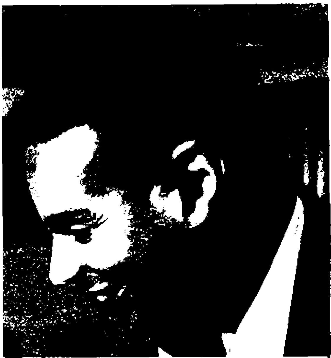
شكل الأذن من الخارج