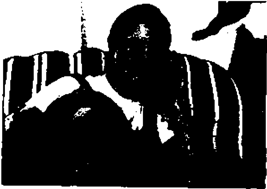
الأذن عضو السمع