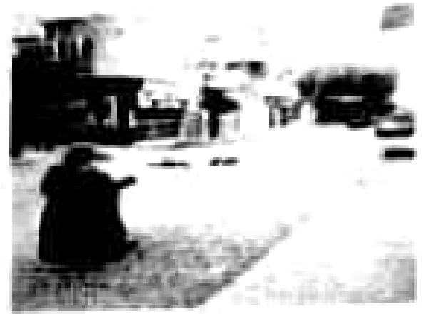
1- هممون الأوساخ في الشارع.....