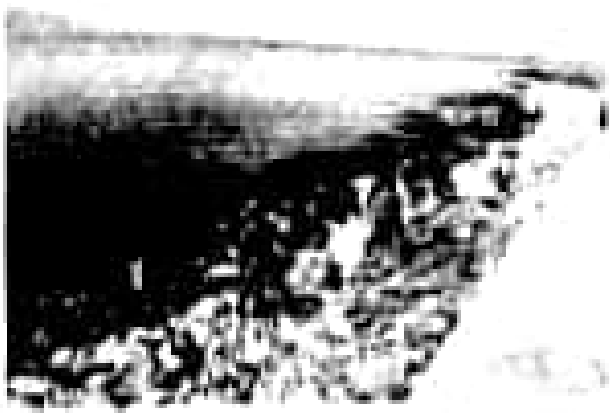
2- نقوم بحملة لتنظيف الشاطئ.....

ضع اشارة ( ✓ ) تحت التصرف الصحيح وشارة ( ✗ ) تحت التصرف الخاطي: