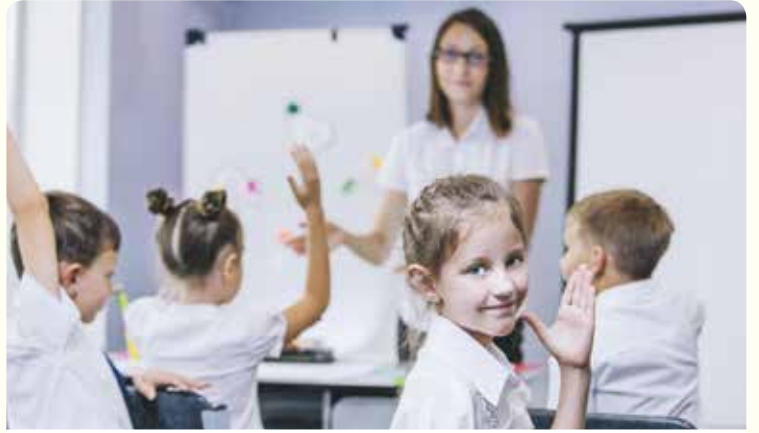
التعلّم من خلال سرد القصص

نَحْنُ الآنَ عَلَى عِلْمٍ بِكُلِّ شَيْءٍ حَوْلَ الْقِصَصِ وَسَرِدِهَا. هَلْ تَتَذَكَّرُ الْغَرَضَ مِنَ الْقِصَصِ؟ وَمَا الْأُمُورُ يُمَكِّنُهَا أَنْ تُعَلِّمَنَا إِيَّاهَا؟