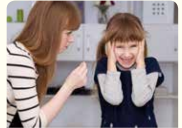
3. لا تصغي إلى نصائح الوالدين