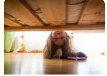
1. افترضت لعبة صديقك وأضعتها.