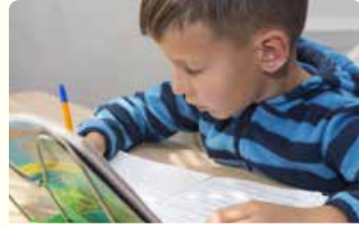
طالبٌ يكتُبُ فُصْنَه