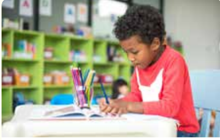
طالبٌ يرسمُ قِصَّةً

ازيّم صُورَةَ لِلْقِصَّةِ الَّتِي تُرِيدُ سَرَدَهَا عَنْ أَحَدِ جَوَانِبِ تُرَاثِكَ. تَذَكَّرْ إِذْرَاحَ أَكْبَرَ قَدْرٍ مُمَكِّنٍ مِنَ التَّفَاصِيلِ لِأَنَّ ذَلِكَ سَيُسَاعِدُكَ عِنْدَ مُشَارَكَةِ الْقِصَّةِ مَعَ طَلَبَةِ الصَّفِّ.