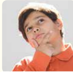
كَيْفَ أَظْهِرُ اهْتِمَامِي؟

فَكِّرْ أَيْضًا فِي عَوَاقِبِ هَذِهِ الْأَعْمَالِ. نَاقِشْ أَعْمَالَكَ مَعَ زَمِيلِكَ.