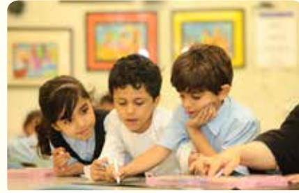
الإغتناء بالأصدقاء في المدرسة