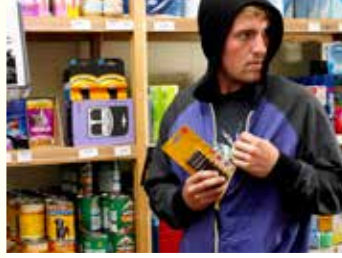
2. في المتجر، رأيت صديقًا يضع شيئًا في جيبه من دون دفع ثمنه.