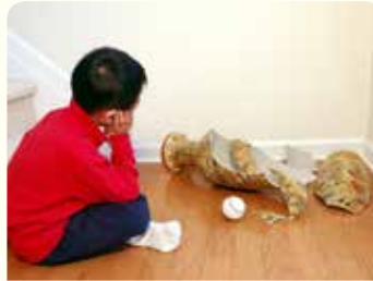
4. كسرت زهرية والدتك من دون قصد أثناء اللعب في المنزل.