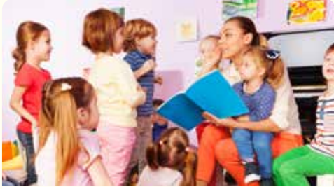
حانَ وَفَتُ القِصةِ

3 هُناكَ أنواعٌ كثيرةٌ مُختلفةٌ مِنَ القِصصِ. كَمَ نَوْعًا مُختلفًا مِنْها يُمكنكَ تسميةً؟ هل يُمكنكَ إعطاءَ بعضِ الأمثلةِ لِلأنواعِ المُختلفةِ مِنَ القِصصِ؟