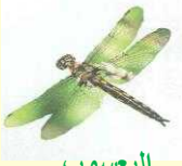
اليعسوب يعيش في الصحراء

أَجْمَعُ صُورًا لِحَيَوَانَاتٍ لافَقَّارِيَّةٍ، ثُمَّ أُسَمِّيهَا، وَأَتَعَرَّفُ أَمَاكِينَ مَعِيشَتِهَا.