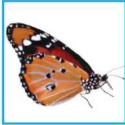
فراشة مكتملة النمو

٩- التتابع. أرتب صور دورة حياة الفراشة التالية باستخدام الأرقام من ١ إلى ٤.