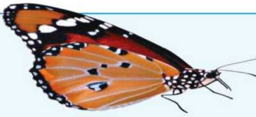
فراشة مُكتملة النُمو