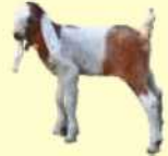
مَاعِزٌ حَدِيثُ الْوِلَادَةِ