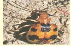
الخنفساء تعيش في الصحراء