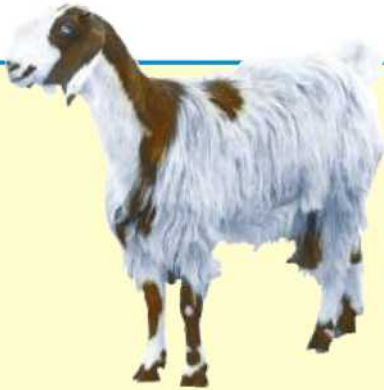
مَاعِزٌ مُكْتَمَلُ النَّمُو