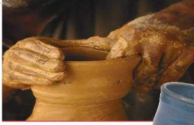
► ثوب مَشْغُوعٌ مِنَ الطِّينِ