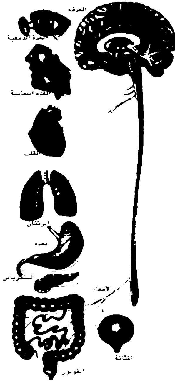
الجهاز العصبي وتحكمه في أجهزة الجسم