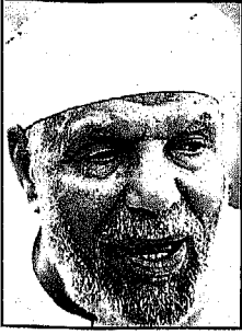
● الشيخ متولى الشعراوى