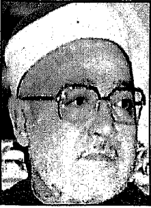
● الشيخ محمد الغزالي