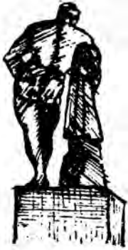
( شكل ١ )

تناسب الأجزاء . وفى شكل هرقل مثلاً ( شكل رقم ١ ) إتساق بين الأجزاء كافة . فهى تعبر عن القوة والجبروت . ويبدو هذا فى ضخامة عظام الصدر والأكتاف وفى تناسب عضلات الأجزاء العليا ، مع عضلات الأجزاء السفلى فى الجسم .