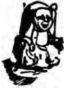
( شكل ٤ )

ويعرف هوجارث تعقد الأشكال بأنه خاصة في الخطوط التي يتألف منها الشكل تدفع العين إلى نوع من المطاردة . وبسبب حدوث لذة من جراء ذلك ، تسمى الخطوط أو الأشكال جميلة . وبهم هوجارث هذه الخاصة باعتبارها الأساس الذي تعتمد عليه فكرة الرشاقة أكثر من اعتمادها على أي مبدأ من المبادئ الأخرى ، ما عدا التنوع . والشكل عندما يتألف من خطوط معقدة يوهنا بالحركة . لهذا يلجأ المصورون إليه عند رسم الرقصات القروية . فنحن لن نستطيع اعتماداً على خطوط بسيطة مستقيمة تخيل الإنحناءات والانشاءات التي تصحب الحركة . ويضرب هوجارث مثلاً آخر للجمال الذي يظهر في الخطوط المعقدة البعيدة عن البساطة ، وهو منظر شعر الرأس ، الذي يزداد جماله كلما بدا مجعداً . وكما تغزل الشعراء في منظر الخصلات المعقدة ! التي ترغم العين على عدم الثبات والإلتفات بئمة ويسرة .