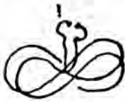
( شكل ٥٢ )

وأكثر الرقصات تعبيراً عن الخطوط الإنسيابية هي ( المنويت ) - وهي رقصة مشابهة للفالس كانت شائعة قبل القرن الثامن عشر -