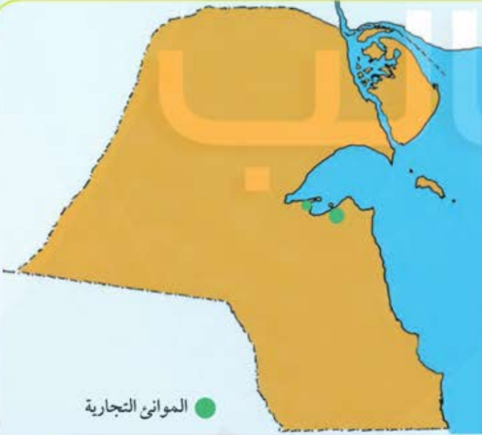
خريطة الموانئ التجارية في دولة الكويت

٢- اكتب أسماء الموانئ التجارية في دولة الكويت على الخريطة مستعيناً بمعلمك . ميناء الشويخ ميناء الدوحة