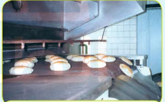
الهيئة العامة للصناعة