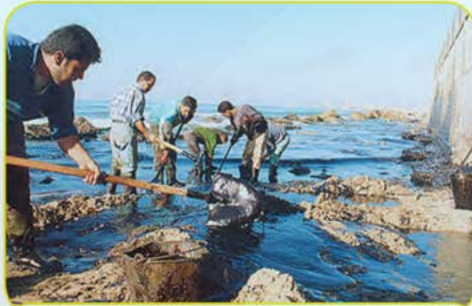
الهيئة العامة للبيئة

نشاط : ٢ صنف الأهداف التالية حسب الهيئات في الجدول التالي : بناء الشباب الكويتي روحاً وجسداً - حماية البيئة من التلوث - تشجيع العمالة الوطنية - تنوع الصناعات المحلية - تنظيم المهرجانات والمسابقات - المحافظة على البيئة الطبيعية .