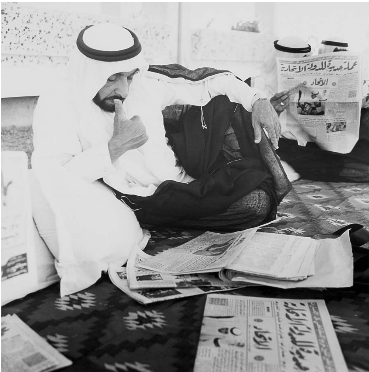
سمو الشيخ زايد يطالع صحيفة «الاتحاد» وقد عُرف عنه شغفه بالقراءة ومتابعة القضايا القومية والدولية.