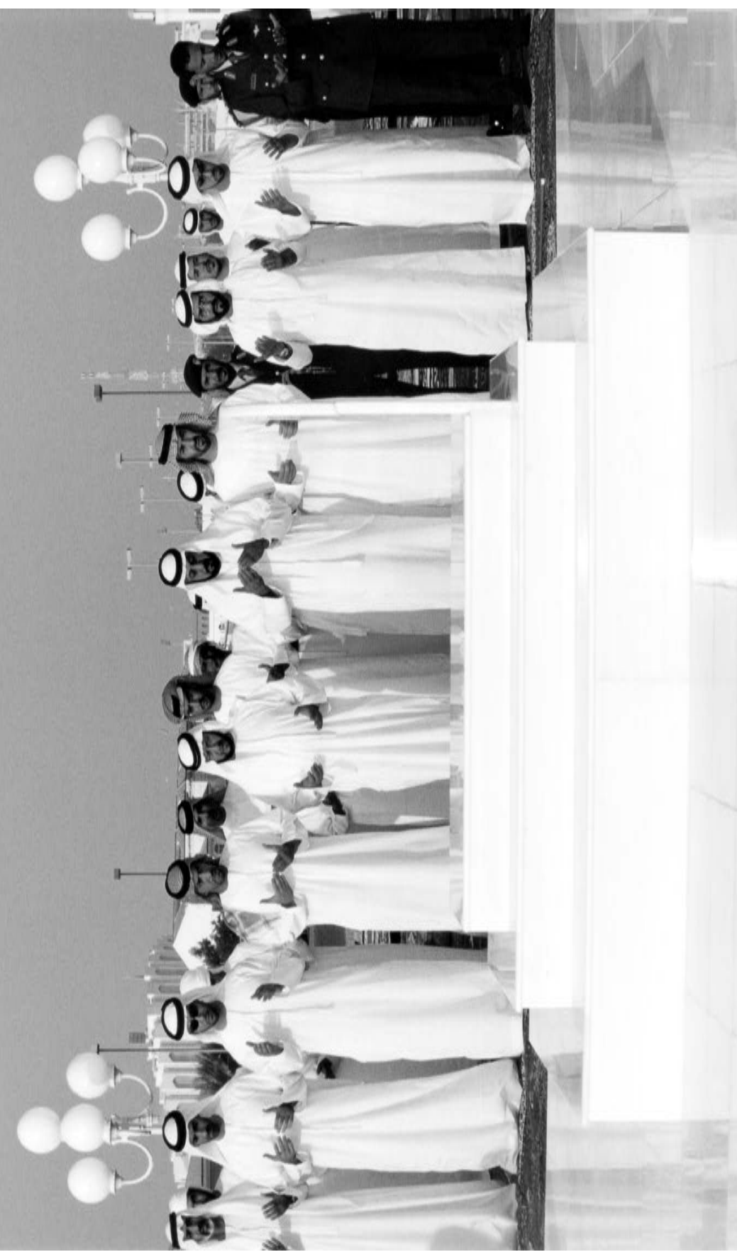
أبناء المغفور له - ياذن الله تعالى - سمو الشيخ زايد بن سلطان آل نهيان وأعضاء من عائلة آل نهيان الكرام يقرؤون الفاتحة ويدعون للفقيد بالرحمة والمغفرة أمام قبره في مسجد الشيخ زايد بن سلطان آل نهيان.