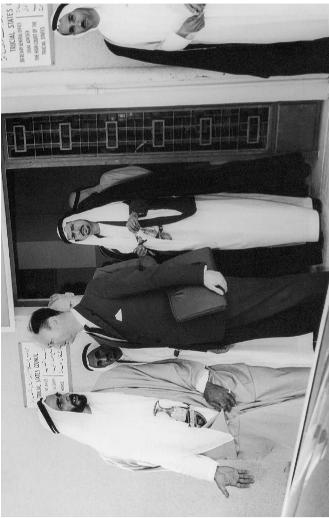
الشيخ زايد أمام مجلس حكام الإمارات المتصالحة الذي تأسس عام 1952 ليكون أول ملتقى لحكام الإمارات.