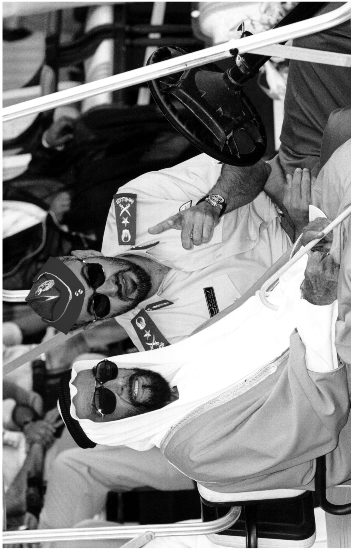
سمو الشيخ زايد بن سلطان آل نهيان - رحمه الله - والفريق أول سمو الشيخ محمد بن زايد آل نهيان ولي عهد أبوظبي نائب القائد الأعلى للقوات المسلحة أثناء مشاهدة عرض حي على هامش معرض الدفاع الدولي «أيدكس 2003».