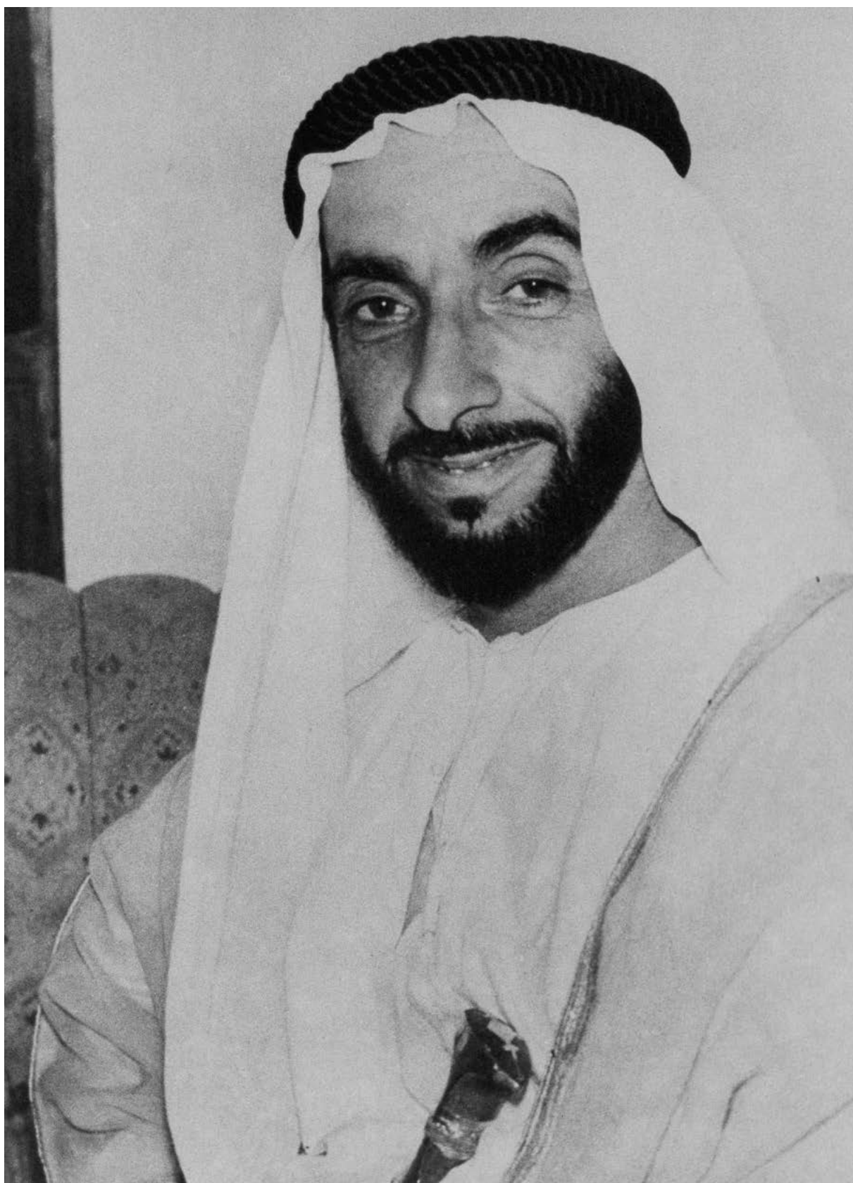
في عام 1966 أبدت الحكومة الأمريكية اهتماماً بالغاً بمعرفة المزيد عن حاكم أبوظبي الجديد، وقد أودعت هذه الصورة في أرشيفها.