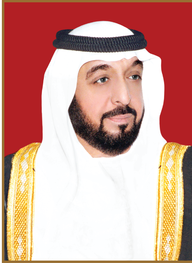
صاحب السمو الشيخ خليفة بن زايد آل نهيان رئيس دولة الإمارات العربية المتحدة، حفظه الله

”يجب التزوّد بالعلوم الحديثة والمعارف الواسعة والإقبال عليها بروح عالية ورغبة صادقة، حتى تتمكّن دولة الإمارات خلال الألفية الثالثة من تحقيق نقلة حضارية واسعة.“