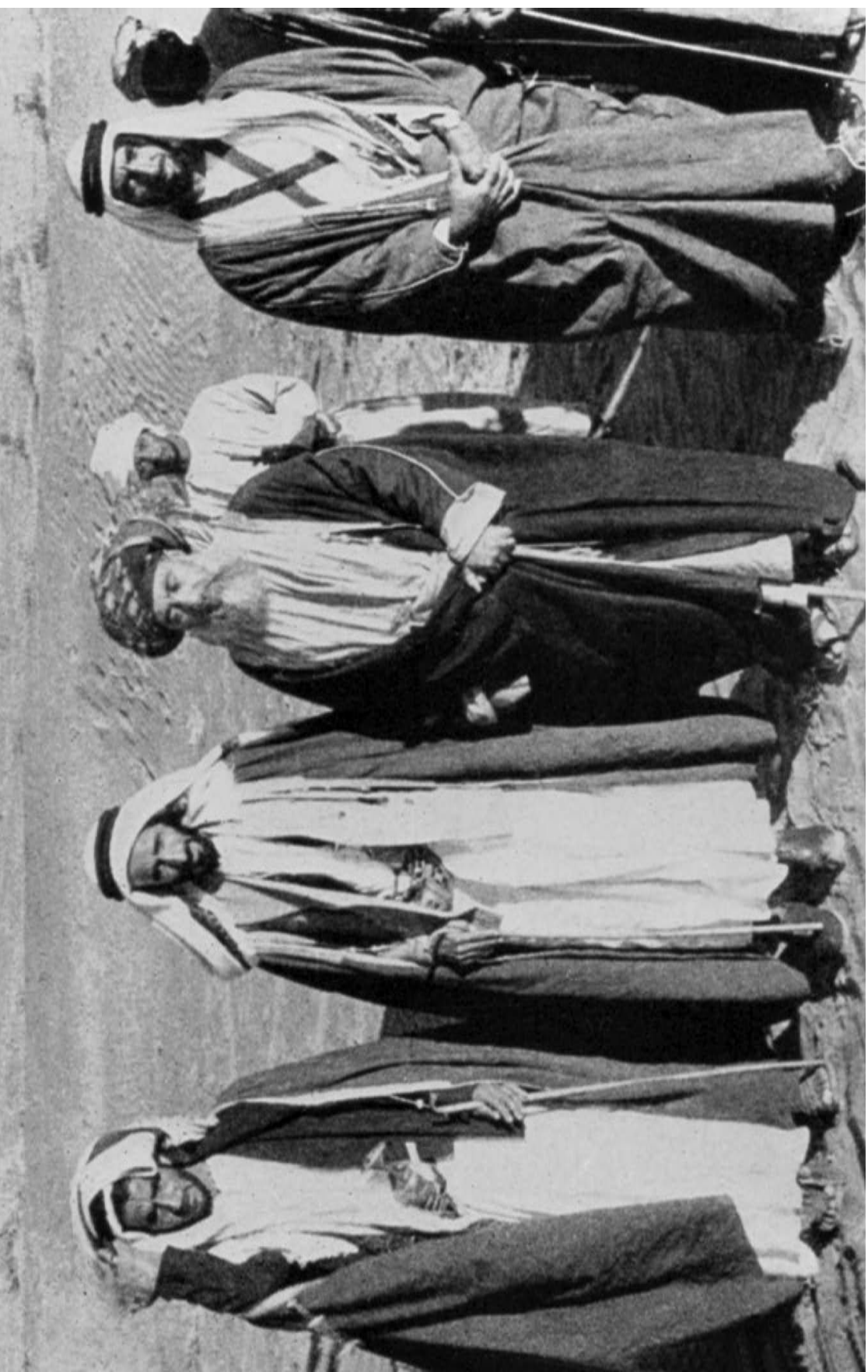
الشيخ زايد في اللقاء التاريخي الذي جمع الشيخ شخبوط حاكم أبوظبي حينئذ وسلطان مسقط في كانون الأول /ديسمبر 1955 في واحة العين.