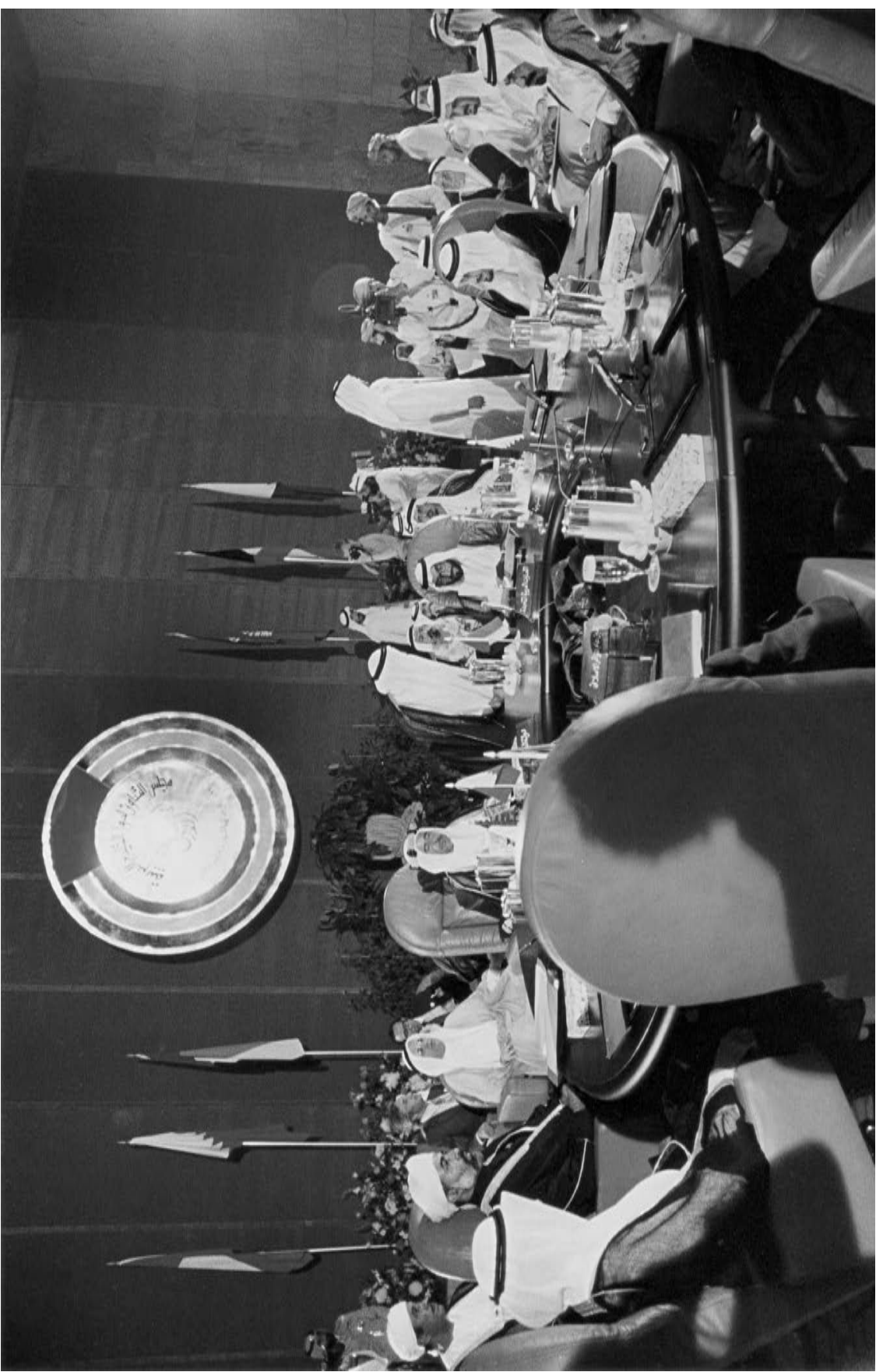
سمو الشيخ زايد يتراس الاجتماع الأول لمجلس التعاون لدول الخليج العربية في إمارة أبوظبي في أيار/مايو 1981 . وقد جاء إنشاء المجلس ليحقق حلمًا طالما راود الشيخ زايد؛ وهو قيام تعاون بناء بين شعوب المنطقة.