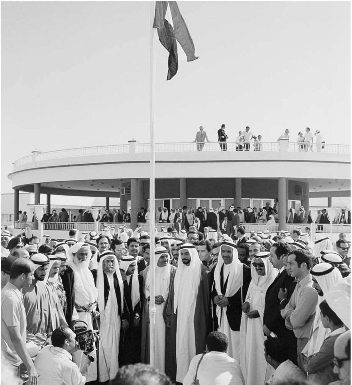
2 كانون الأول/ديسمبر 1971 يوم إعلان قيام دولة الإمارات العربية المتحدة. ويظهر في الصورة سمو الشيخ زايد بن سلطان آل نهيان وسمو الشيخ راشد بن سعيد آل مكتوم وأصحاب السمو حكام الإمارات الأخرى التي شكلت دولة الإمارات العربية المتحدة عند قيامها.