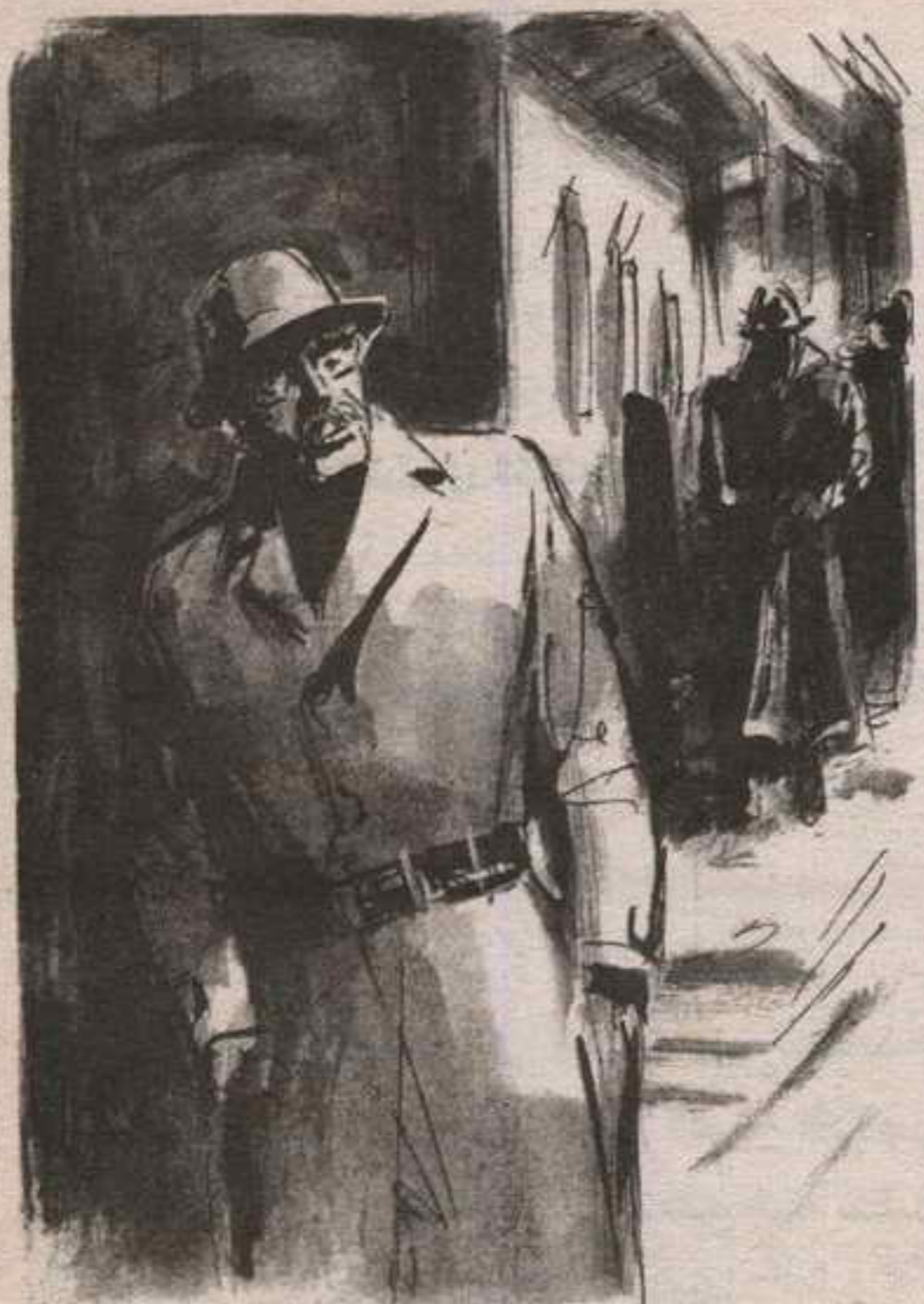
راح الرجل يبحث الخطى ، محاولاً بلوغ أى شارع جانبي ؛ ليتخلص من كل ما تحويه جيوبه ...

رجلان .. بل ثلاثة رجال ، يسرون خلفه طوال