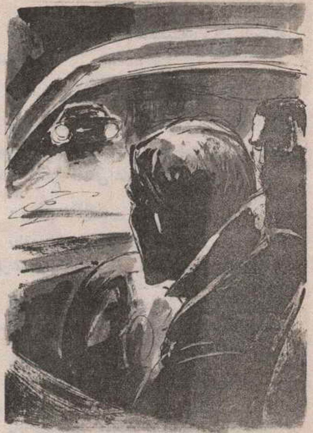
تمتم (بست) ، محاولاً اختراق حجب الظلام ببصره ، بعد أن انطفأ مصباح السيارة تماماً ..

وعلى الرغم من استمرار (بست) و (ستيفنز) في عملهما ، ومن التقائهما بالألماني (شيلنبرج) مرتين آخرين ، خلال الفترة من أوائل مارس ، وحتى أوائل سبتمبر ١٩٣٩ م ، إلا أنهما قد فقدتا الحماسة للعملية إلى حد ما ، خاصة وأن شيئاً ما في (شيلنبرج) لم يكن يروق للميجور (ستيفنز) ، على عكس زميله (بست) ، الذي كان يرى أن ذلك الألماني نموذج مثالي لأي رجل مخابرات ، أيّاً كانت هويته ، فهو رياضي ، ممشوق القوام ، هادئ الحديث ، يطلّ الذكاء من عينيه في وضوح ، ويتروّى ليفكر جيداً ، قبل أن يدلي بأي رأي ..