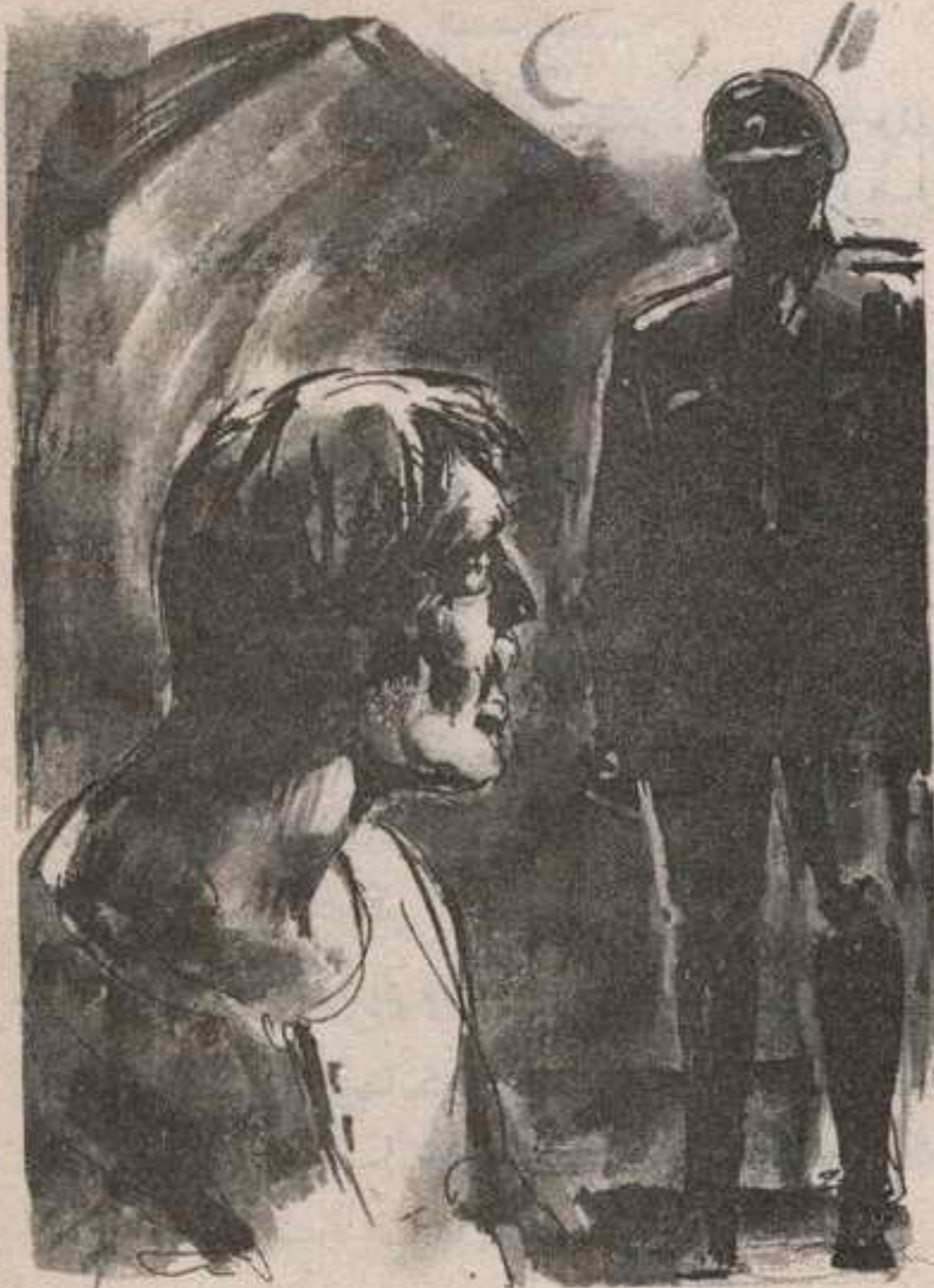
حتى أصبح الضابط النازى الوسيم وحده فى القبر ، يتطلع فى صمت صارم ، إلى العميل ..

حدق العميل فيه طويلاً فى صمت ، وقد امتلأت نفسه برهبة عجيبة ، جعلته غير قادر على التفوه بحرف واحد ، ف جذب (شلنبرج) مقعداً ، كما فعل الضخم من قبل ، وجلس على مسافة متر واحد