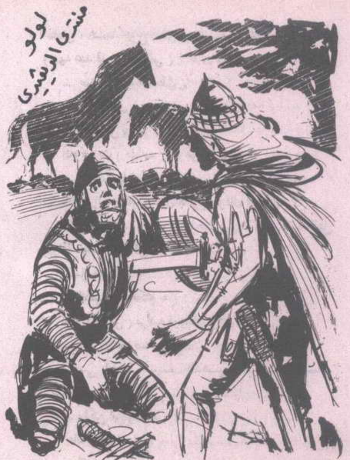
وشهق القشتالي في ألم ، واضطبغت عيناه بلون الدم ، ثم انتفض ، عندما انتزع ( فارس ) سيفه من قلبه ، وهوى على وجهه عند قدمي ( فارس ) ..