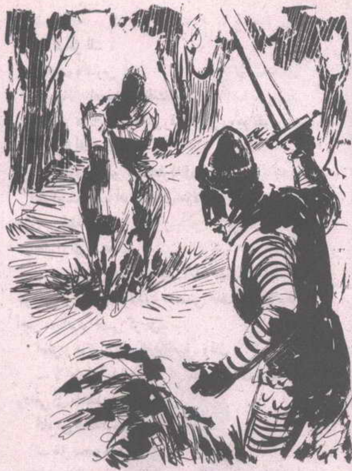
ابتسم (فرانثيسكو) لشكوك (هاكل)، وبرز من خلف الشجرة، ورفع سيفه هاتفاً في وجه القادم: من أنت؟