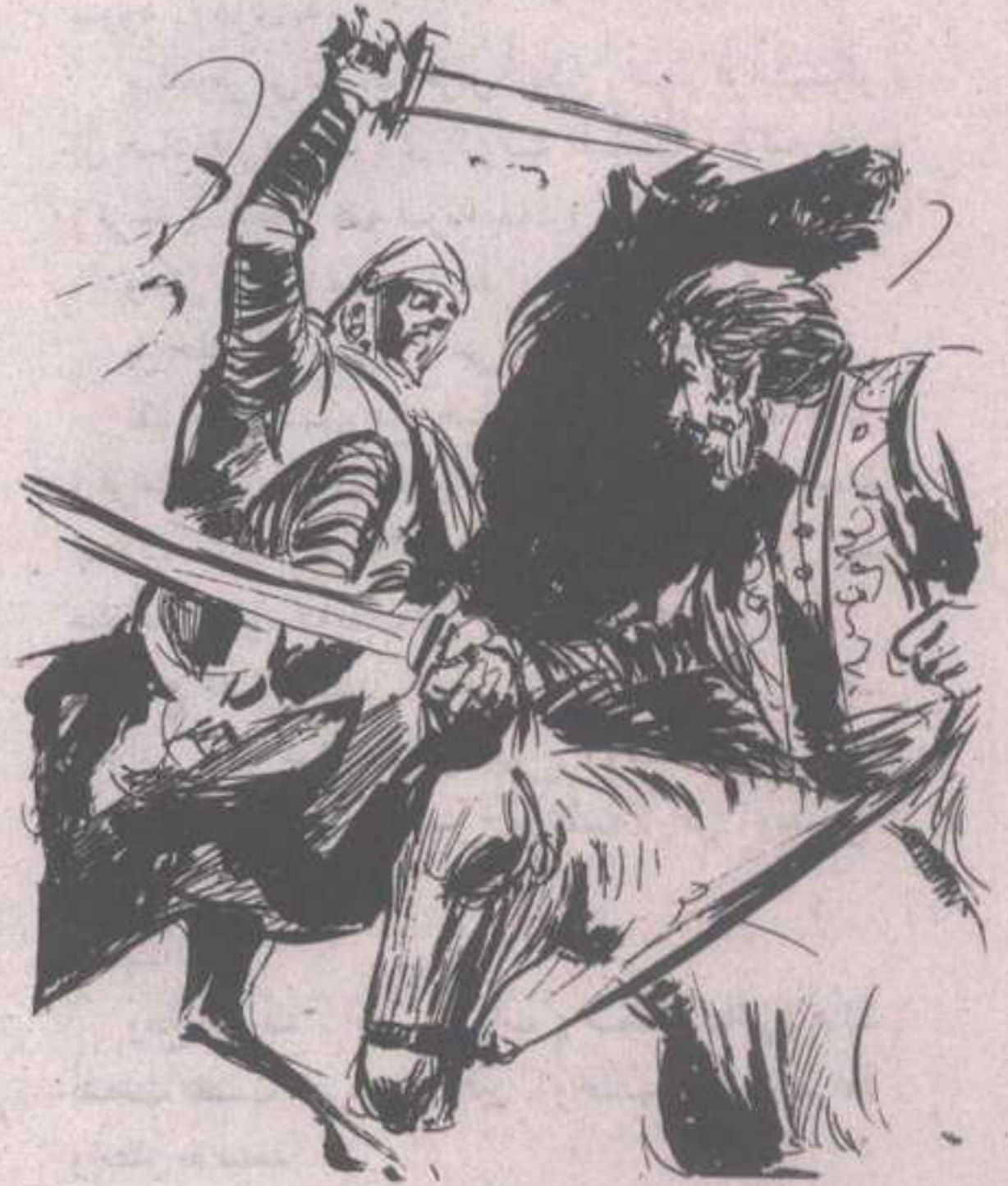
انزلق السرج ، وفقد ( فرانثيسكو ) توازنه بغتة ، وانزلق مع السرج ليرتطم بالأرض ..