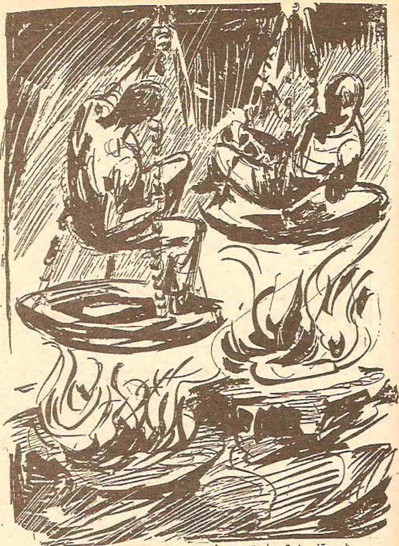
ثم وقف فوق المحرقة وقد أمسك بالسلاسل المعدنية المدلاة من