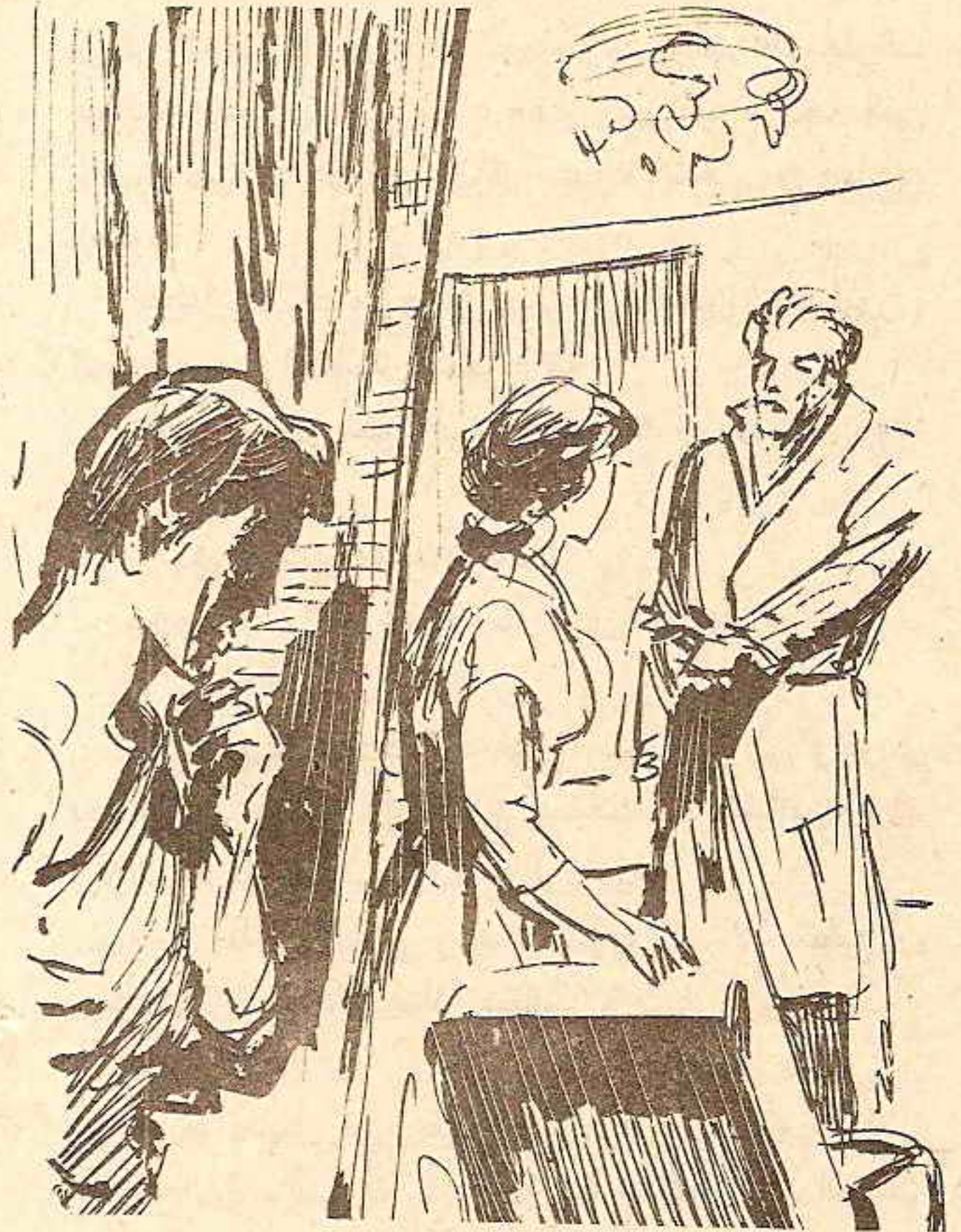
توارى وراء ستار ، ليراقب الردهة التى يتحدث منها الرجل مع الفتاة ، محاولاً التيقن من صاحب الصوت ..

- إننى لم أحاول التجسس عليك .. ولقد رأيت ذلك مصادفةً بوساطة منظاري المقرب .. عندما كانت السيارة