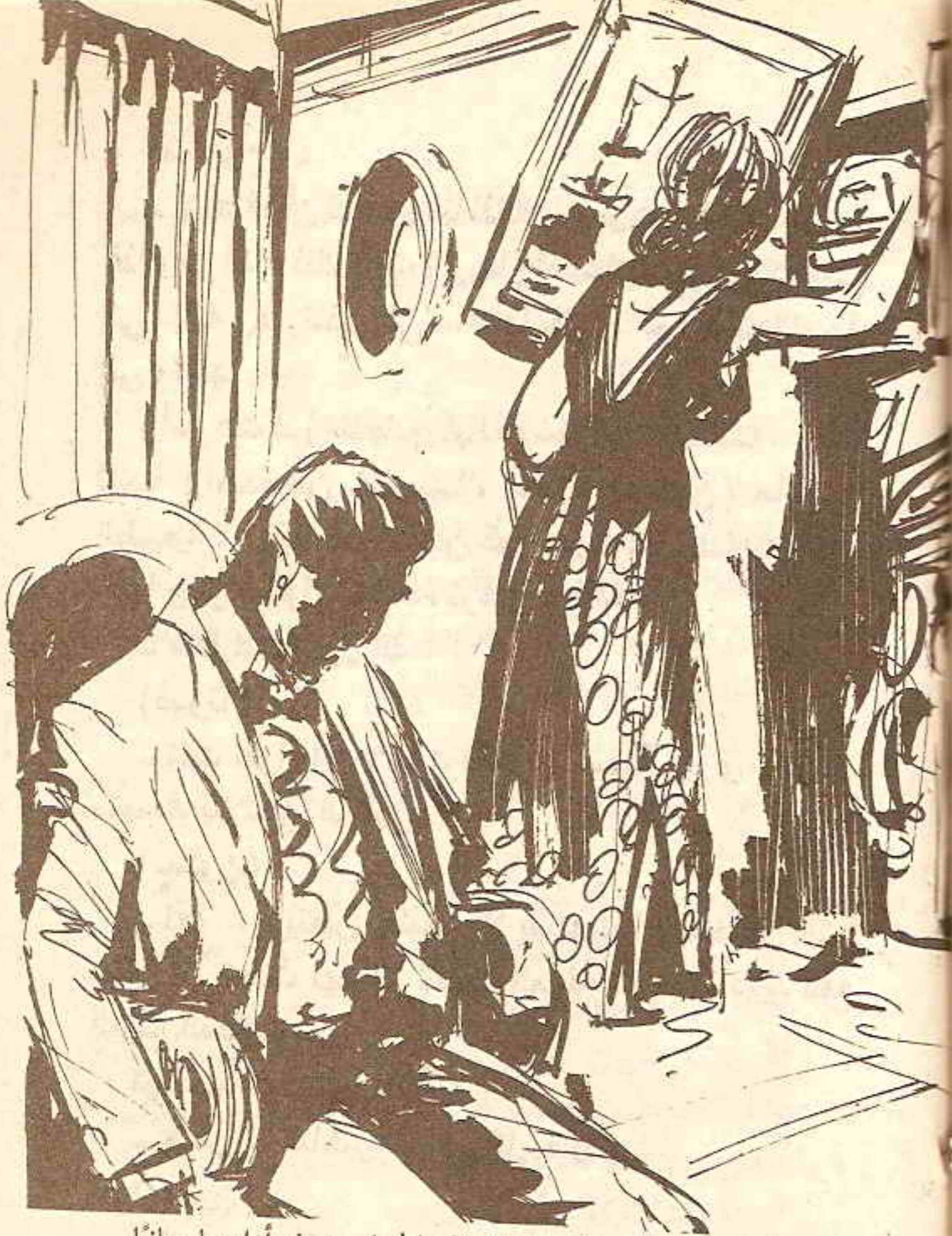
واندفعت إلى إحدى اللوحات المعلقة على الجدار حيث أزاقتها جانباً لتكشف عن باب خزانة معدنية صغيرة ..

وعلى الفور نهضت (فيرنا) من مكانها .. واندفعت إلى إحدى اللوحات المعلقة على الجدار حيث أزاقتها جانباً لتكشف عن باب خزانة معدنية صغيرة وضغطت مقبض الخزانة إلى أسفل .. فانفتح بابها كاشفاً عن جهاز اللاسلكي الذي يستخدمه (ستون) .