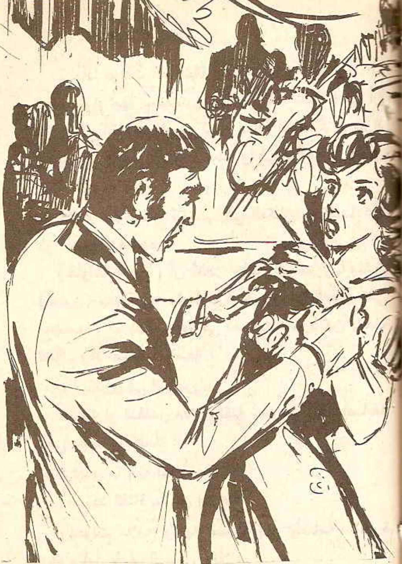
ثم قبض على معصم يدها الممسكة بالمبرد بقوة أمتها ..

وكانت الموسيقى قد توقفت .. كما توقف معها الراقصون وهم في دهشة وتساؤل على إثر الصرخة التي أطلقها الرجل واقتحامه لحلبة الرقص بهذه الطريقة المباغته ولكن ما إن اقترب من (ستون) حتى قال الأخير بصوت مسموع ونبرة هادئة :