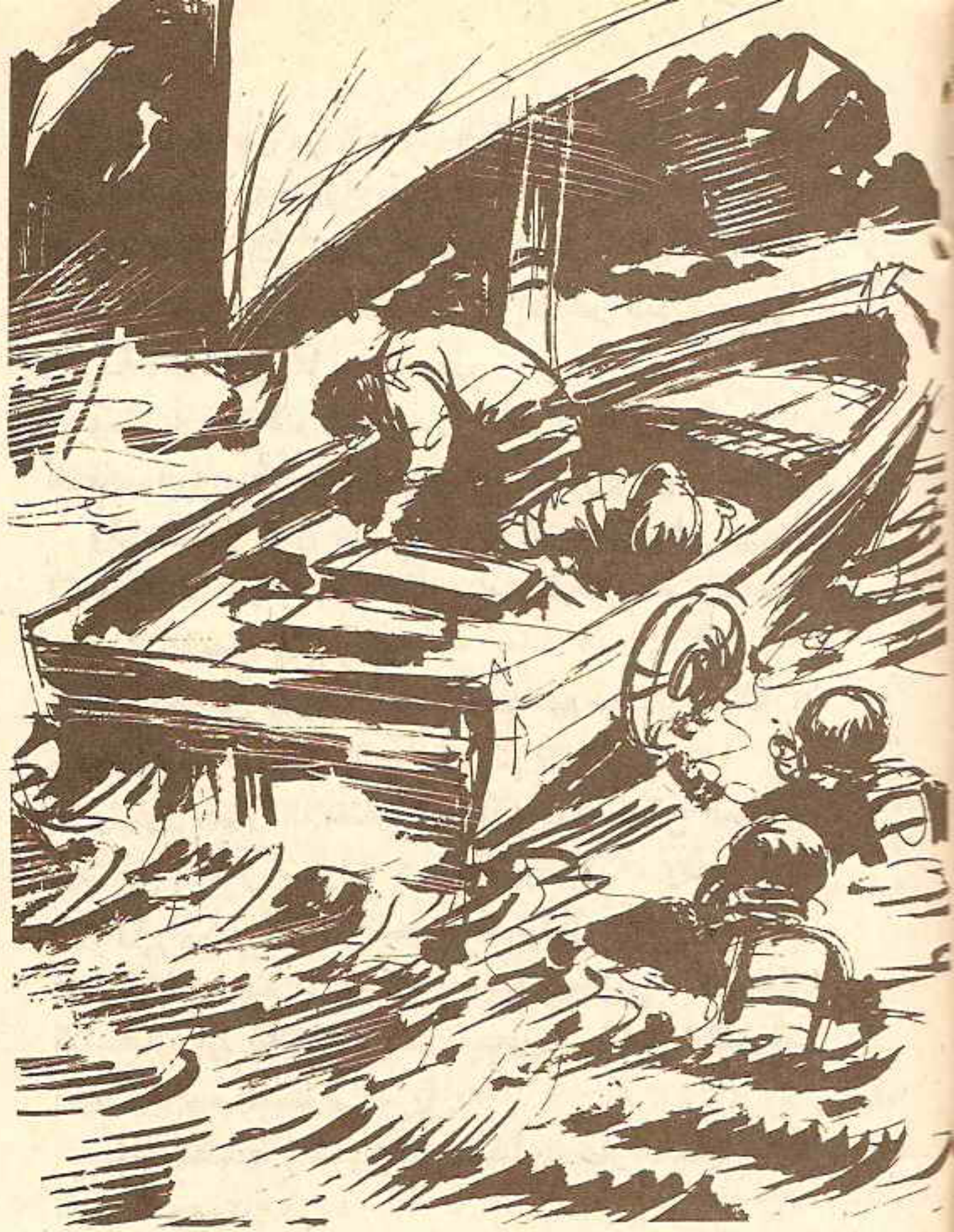
حتى شعر الرجلان فوق ظهرها بدوار يعتريهما ، ثم ما لبثا أن سقطا فوق سطحها غائبين عن الوعي ..