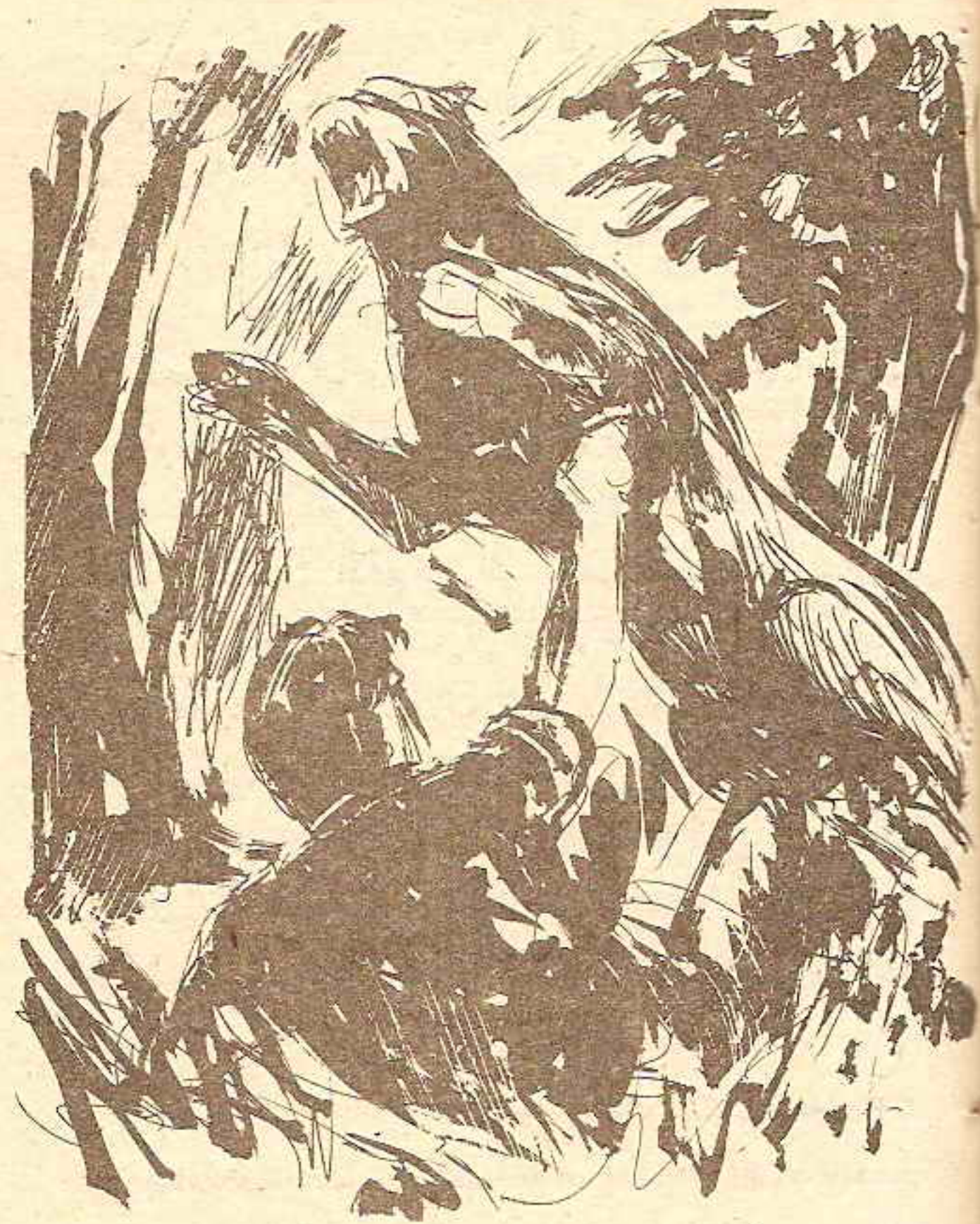
واستقر نصل الخنجر في عنق الفهد ، الذي أطلق زجرة قوية ..

ولكن (مدوح) جذب خنجره في سرعة ليقذفه في اتجاه الفهد لحظة وثوبه نحوه ، وهو يستدير ليستلقى على جنبه سريعا ..