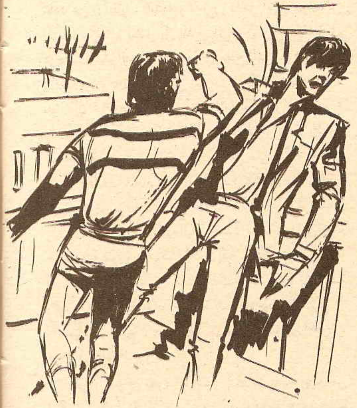
وأعقبها بلكمة تالية ، جعلت جدع (ممدوح) يميل إلى الخارج ، من فوق حافة السور

وكاد (ممدوح) يلقى حتفه ، لولا أن ساق له حظه في أثناء سقوطه لوحة إعلانية بارزة ، كانت هي أمله الوحيد في النجاة ، فتشبث بها بكل قوته ، في حين سارع (شيفي)