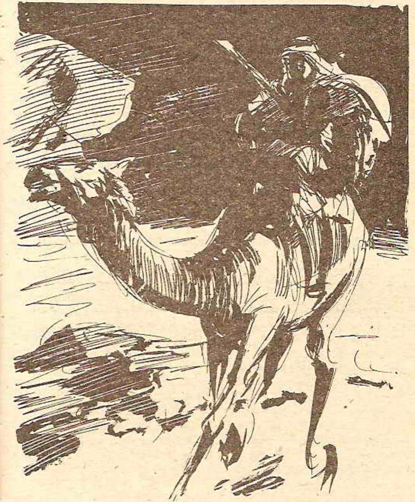
ثم انطلق بالناقة بين الجبال ، وهو يستحثها على الإسراع ، ليهرب من مطارديه ..

أعرفه .. لقد طلبت منى خدمة ، واتفقت معك على المقابل ..