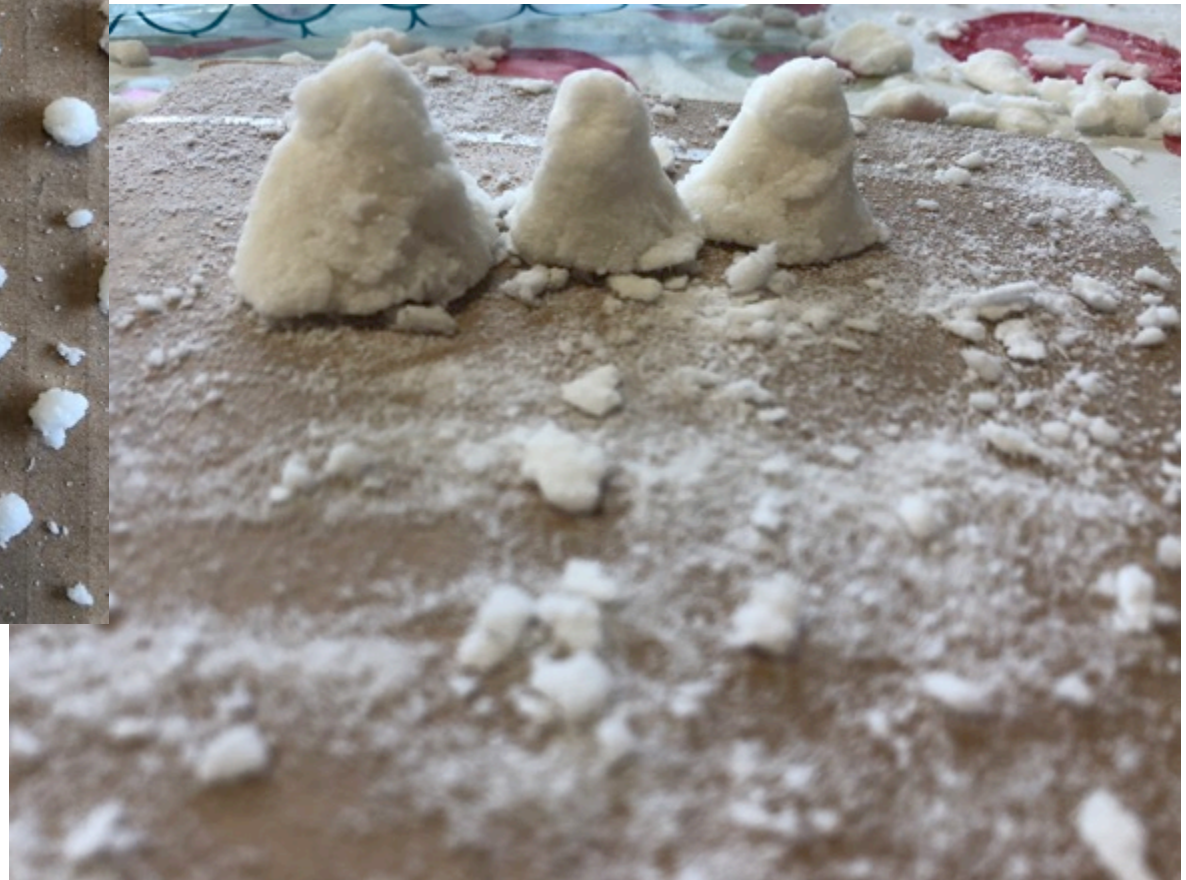
Le montagne di zucchero (Tommaso)