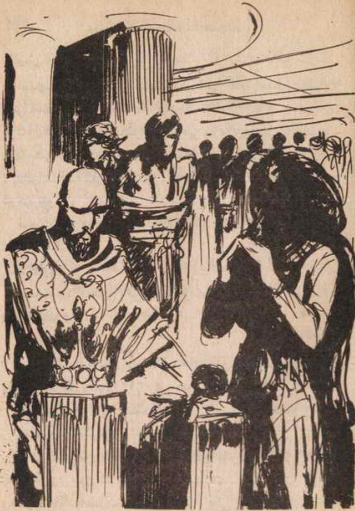
فارتفعت اسطوانة أخرى ، تحمل على قممها تاج من الذهب ..

لم يتم عبارته ، فهتفت به ( سلوى ) ، في صوت خافت :