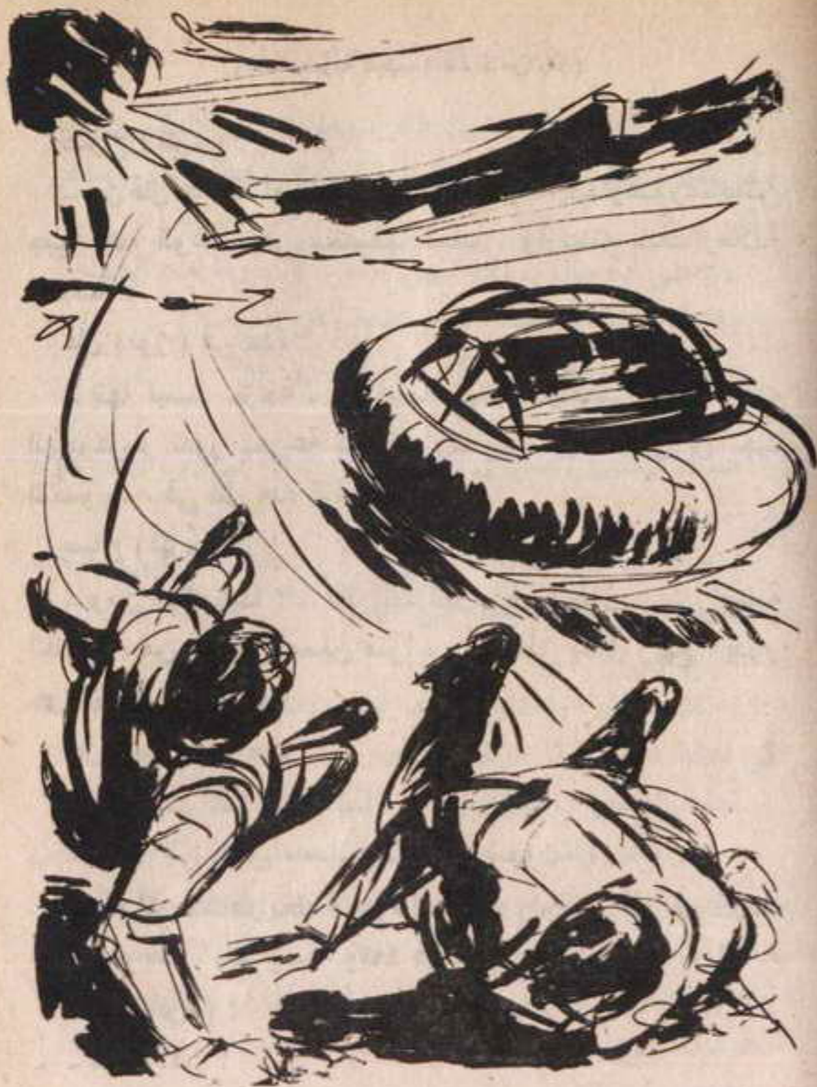
انفجرت الهليوكوبتر في قوة ، وكان دوتها يخرق آذانها ، وهما يرتطمان برمال الصحراء ويتدحرجان فوقها في عنف ..