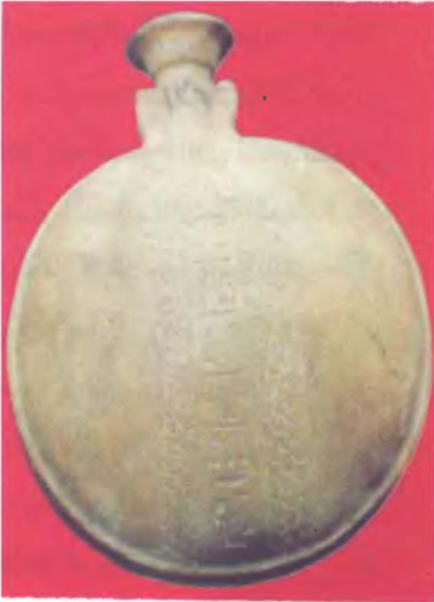
إتاء على شكل «زمزية» عصر ملوك سائس

قبل أن تقص على جميع ماجرى منذ عهد الملك نيخاو وحتى عهد ذلك الملك أمون حر.