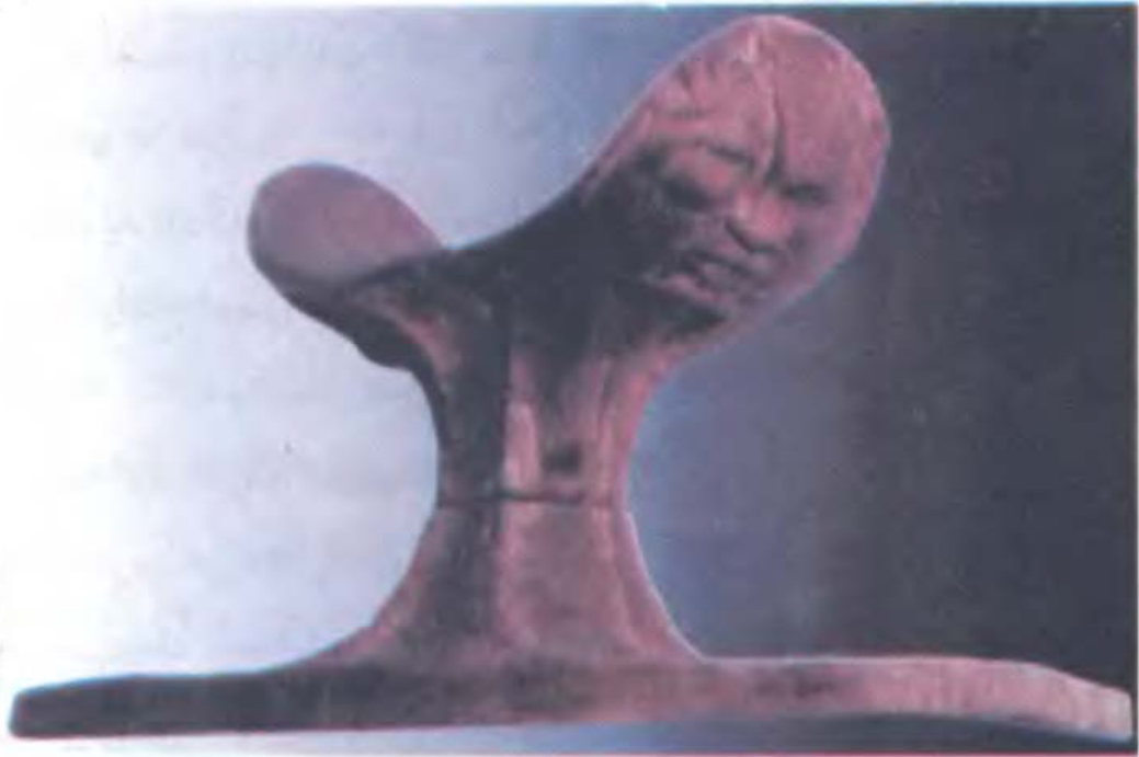
مسند الرأس «عصر الأسرات المتأخرة»

وخاصةً كهنةَ المعابدِ أصحابِ النفوذِ والقوةِ فى مصرَ من هذه الإجراءاتِ الماليةِ القاسيةِ، وحينما بدأتِ المعاركُ قاد تآخوسُ الجندَ الأجانبَ على ظهرِ الأسطولِ المصرى فنجح فى تطويقِ الساحلِ الشرقىِّ للبحرِ المتوسطِ ليقطعَ بذلك الطريقَ على أساطيلِ فارسَ، بينما قاد نَقْطَانِبُ الثانى جندَ المصريينِ فى البرِّ، فسار بهم عبرَ أراضى فلسطينَ ولبنانَ إلى أرضِ سوريا