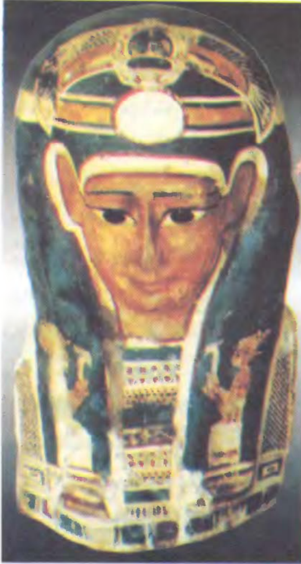
الكساء الخارجى لإحدى المومياءات «عصر الأسرات المتأخرة»

وإخضاع شعبيها لحكومة الإمبراطورية الفارسية. فنظر إلى نظرات غاضبة، ثم راح يصرخ قائلاً: إننا أصحاب حضارة