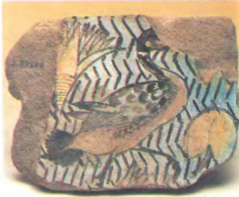
رسم ملونة على الحجر «عصر الاسرات المتأخرة»