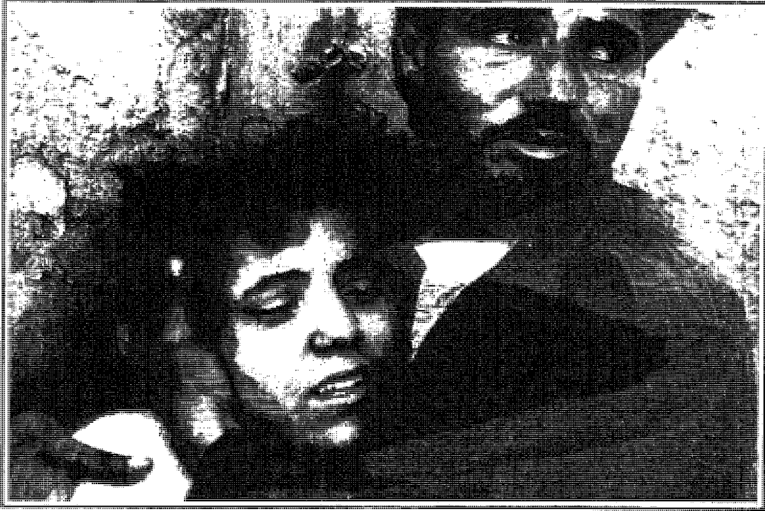
الخوف على الحياة والمستقبل

سَقَطَنَ العام الماضي . وأكثر اللواتي قُتِلْنَ تعرَّضْنَ للإغتصاب، ومثَّلَ القتلة بهنَّ . واحتجز عدد كبير آخر من النساء أشهراً طويلة، وأرغمنَ على ما يُسمَّى «زواج المُتعة» مع عناصر الجماعات المسلَّحة في معسكراتهم .