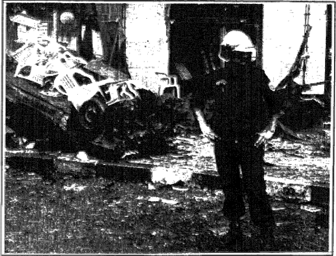
آثار انفجار أصولي في الجزائر

إلى المجلس الدستوري المكلف إعلان شغور سدة الرئاسة ما يلي: «إنه لا يهرب من المسؤولية لكنه اختار سبيل المصلحة العليا للأمة».