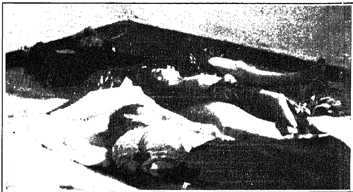
من ضحايا الإرهاب الأصولي