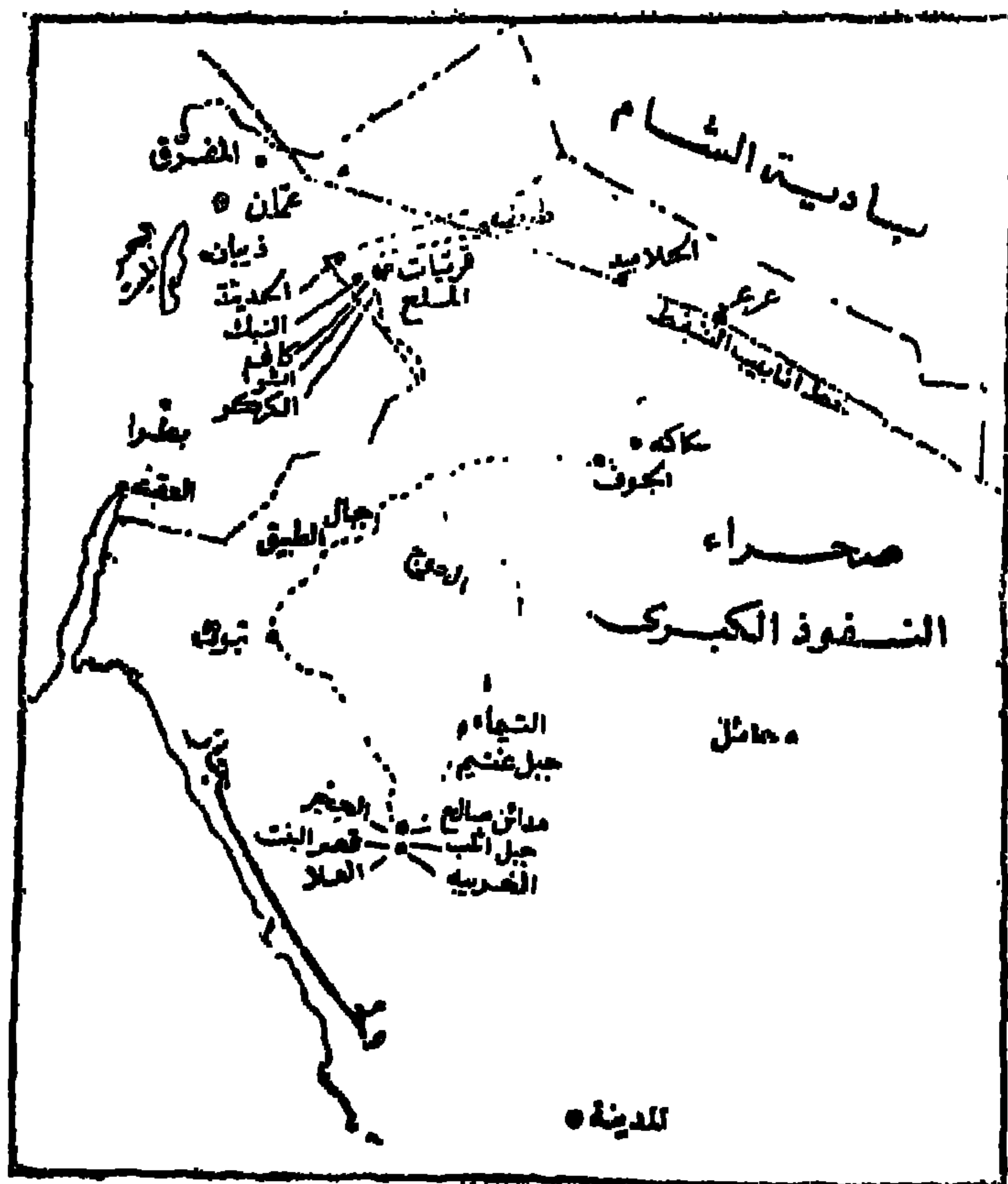
خريطة رقم (٣)