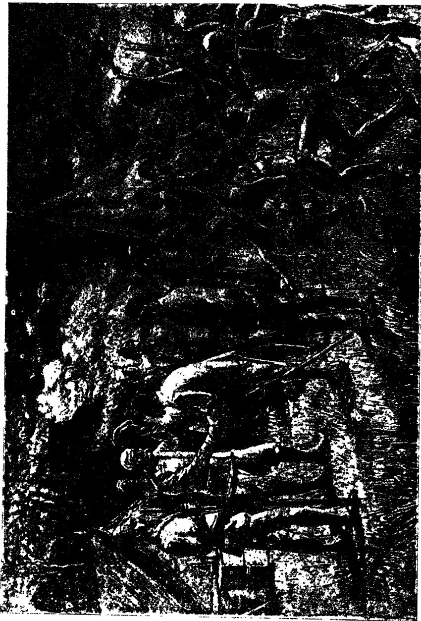
أول مقابلة من أمين باشا و كازاتى لاستانلى فى ٢٩ أبريل سنة ١٨٨٨ م