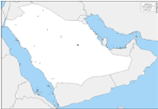
معلمة المادة / حنان الحربي

السؤال الثالث : حددي على خريطة وطني المملكة العربية السعودية مايلي :