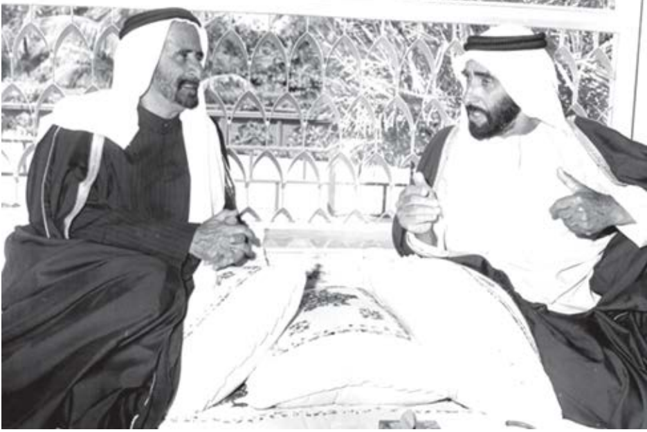
مثلاي الأعليان في القدوة والقيادة والحياة: الشسخ زايد بن سلطان آل نهيان، والشيخ راشد بن سعيد آل مكتوم - طيب الله ثراهما.