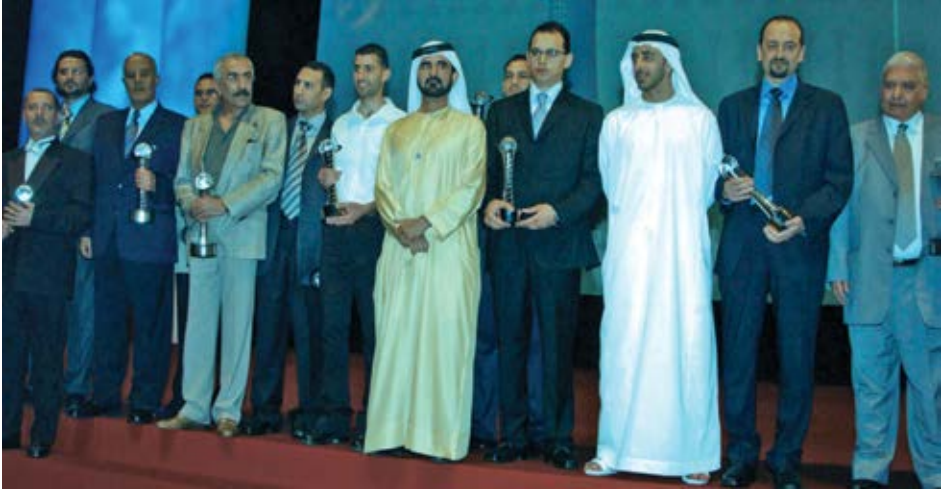
تكريم الصحافة العربية هو تكريم للقلم المبدع والكلمة الصادقة.