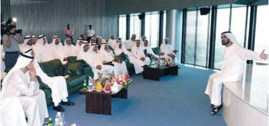
أحرص على التفاعل بشكل دائم مع مسؤولي الدوائر الحكومية: ملاحظات أביديتها خلال لقاء في غرفة تجارة وصناعة دبي بعد تقديم إحدى الشركات الاستشارية خطة عمل استراتيجية للغرفة.