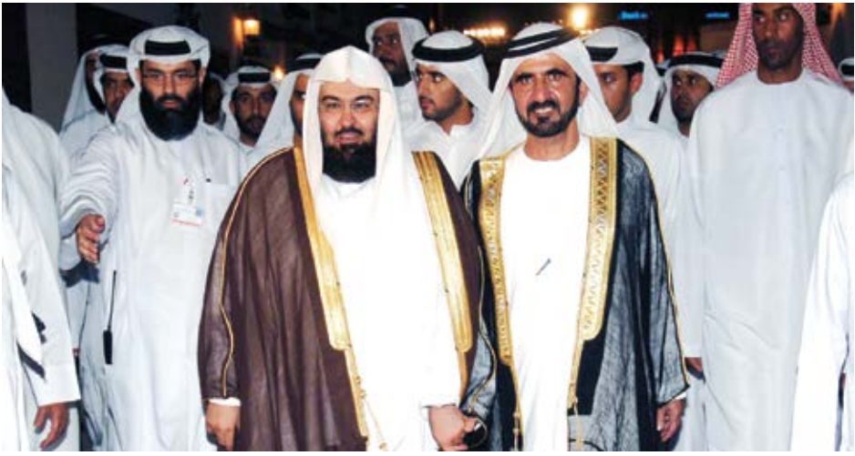
تكريم الشيخ عبدالرحمن السديس شخصية العام الإسلامي.