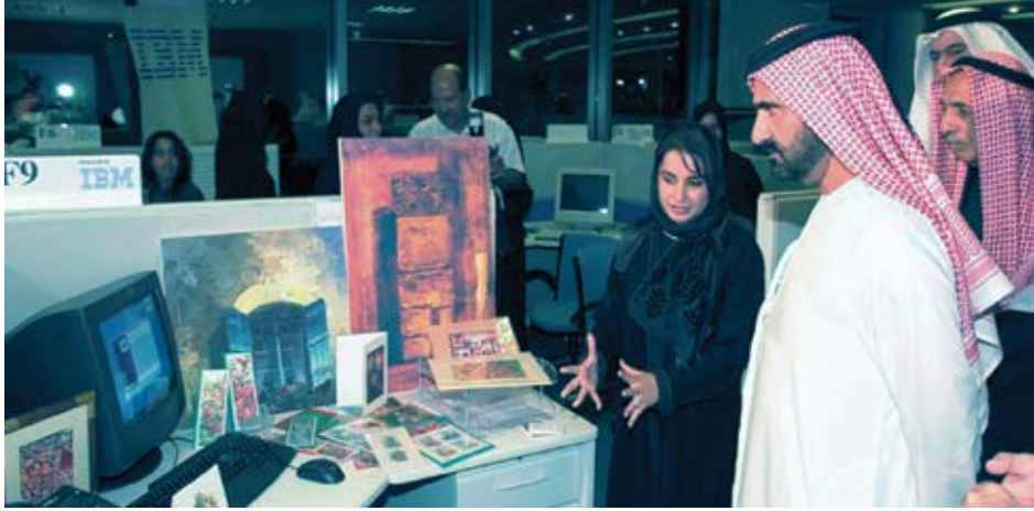
أتاحت حاضنات مشاريع الشباب في مؤسسة محمد بن راشد فرصًا لظهور العديد من سيدات الأعمال الإماراتيات الشابات.