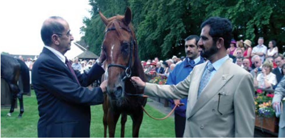
نحرص دائمًا على المشاركة في سباقات الخيل العالمية.