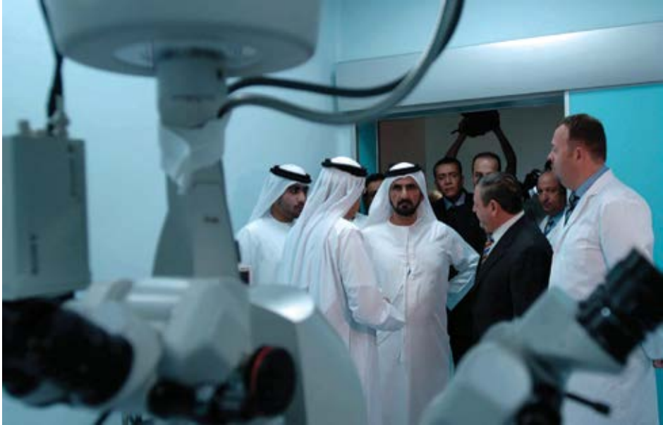
اهتمامي لا يقتصر على القطاع العام فأنا أعتبر القطاع الخاص شريكًا أساسيًا وهو يحظى بدعمي الدائم.