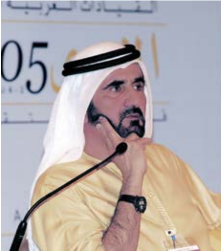
أؤمن بدور القيادات الشابة في ازدهار منطقتنا: خلال مشاركتي في مؤتمر القيادات العربية الشابة.