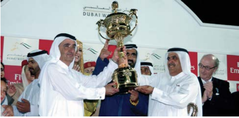
كأس دبي العالمي للخيل أهم سباق للخيل في العالم.