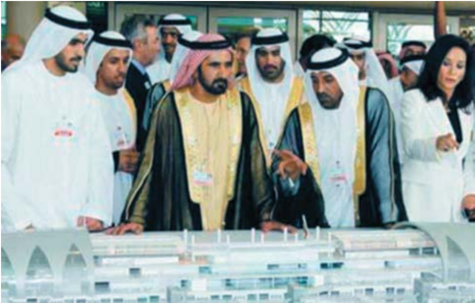
لدى متابعتي مشروع توسعة مطار دبي الدولي.