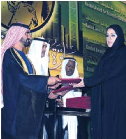
تكریم العلم وتقدير المتعلمين يتصدر دومًا أولويات خطتنا (جائزة راشد للتفوق العلمي).