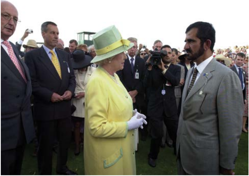
مع الملكة اليزابيث الثانية ملكة بريطانيا.