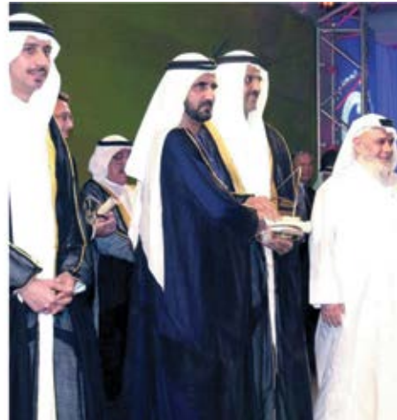
الاهتمام بنشر مفاهيم الجودة في القطاع الخاص من خلال جائزة دبي للجودة.