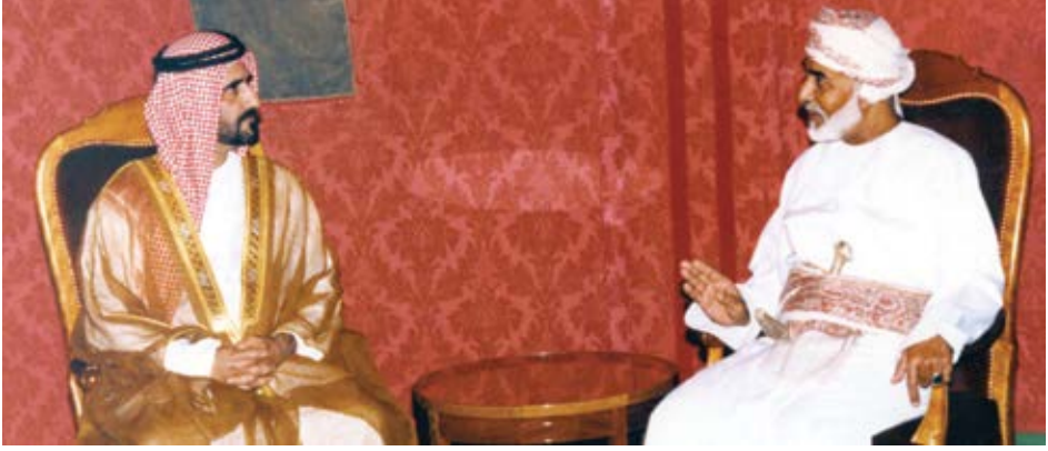
مع أخي جلالة السلطان قابوس بن سعيد سلطان عُمان خلال زيارتي للسلطنة.