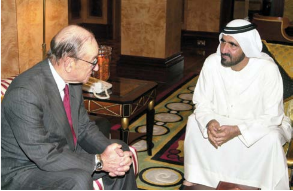
مع ألان غرينسبان رئيس البنك الاحتياطي الفيدرالي الأمريكي السابق في دبي.