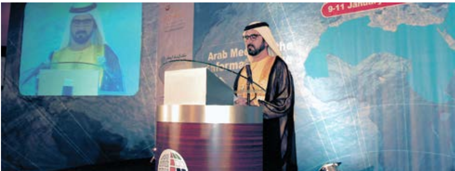
e حدا مسارعتي في المؤتمر السنوي العاشر لمرحز إمارات بدراسات وابحوا إسراييجيه تي ابوصبي.