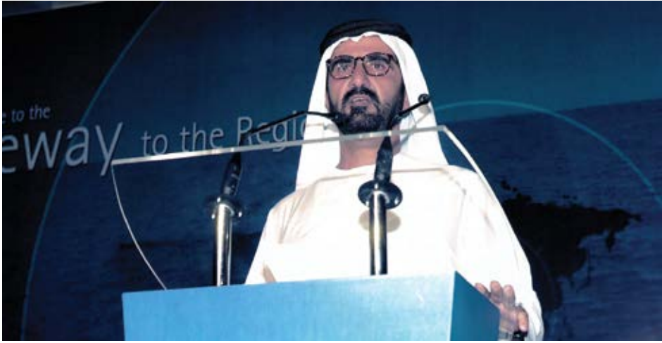
الاعلان عن مركز دبي المالي العالمي.