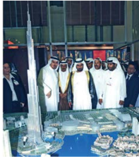
مشروع برج دبي.