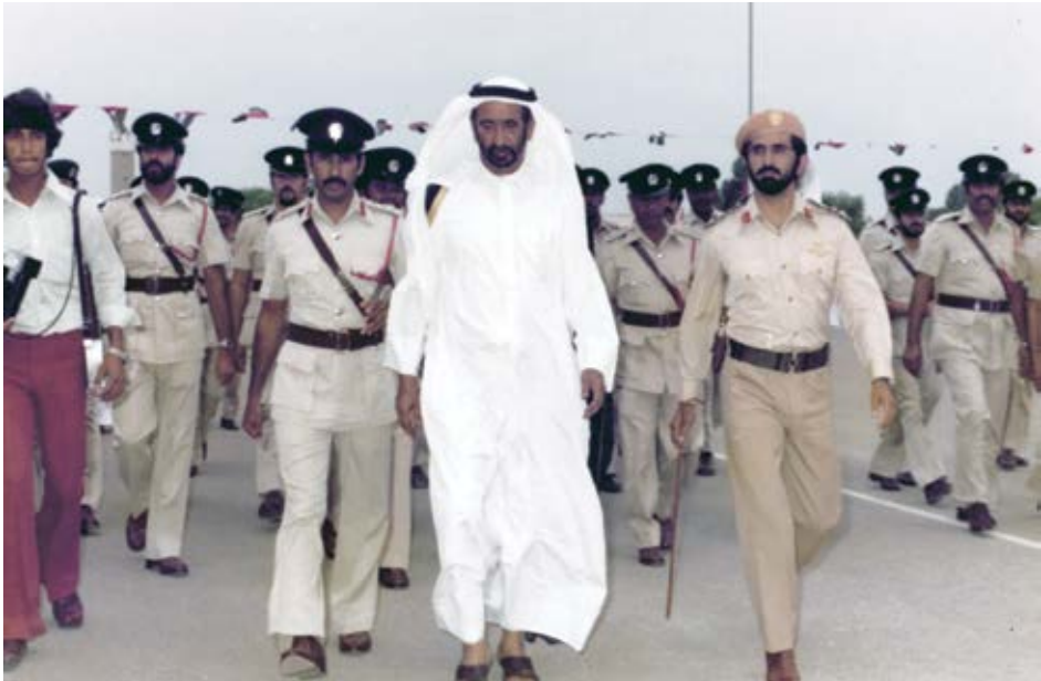
كل ما نقوم به من مبادرات هو استكمال لما بناه والدي الشيخ راشد يرحمه الله.