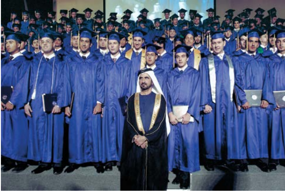
الاحتفال بتخريج دفعة جديدة من طلاب وطالبات الجامعة الأمريكية في دبي.