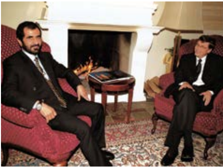
مع بيل جيتس رئيس شركة مايكرو سوفت الأمريكية في منتدى دافوس الاقتصادي العالمي في سويسرا.