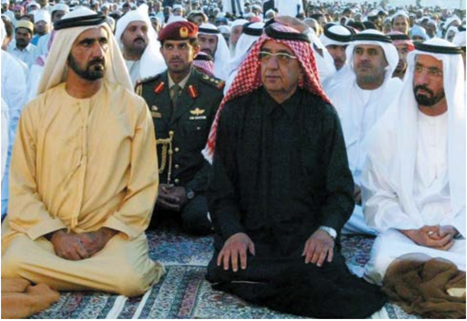
الحرص على أداء صلاة العيد مع المواطنين ومشاركتهم فرحة العيد.