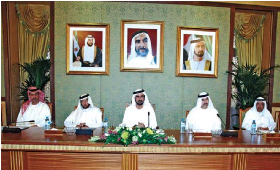
أول اجتماع لمجلس الوزراء.