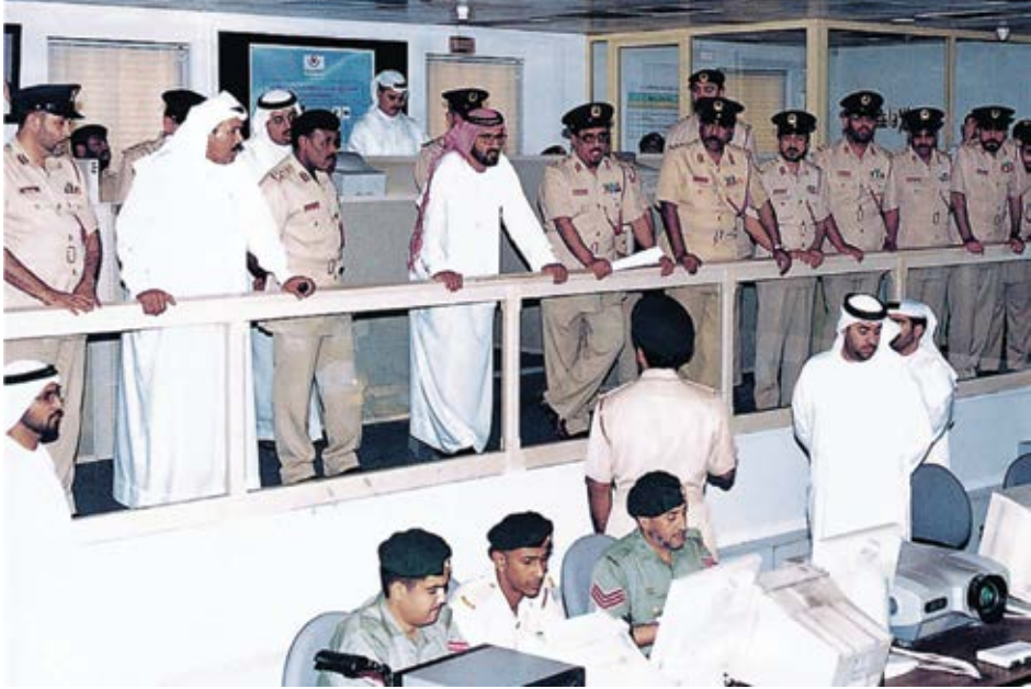
زيارة تفقدية لغرفة العمليات الخاصة بشرطة دبي.