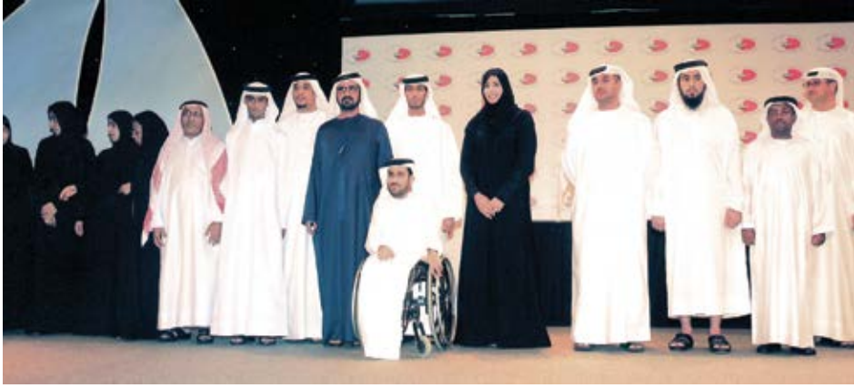
أهتم دومًا بتكريم صغار الموظفين قبل المسؤولين (جائزة الأداء الحكومي المتميز).