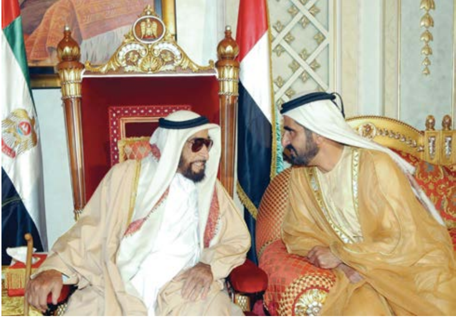
علاقتي بالوالد الشيخ زايد بن سلطان آل نهيان، يرحمه الله، كانت علاقة الأب الناصح لإبنة.