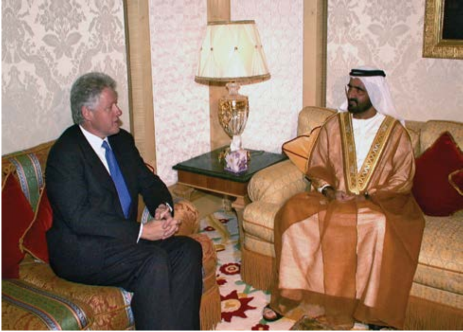
مع الرئيس الأميركي السابق بيل كلينتون خلال زيارته إلى الإمارات.