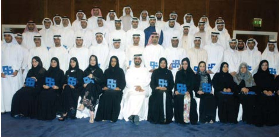
برنامج محمد بن راشد لإعداد القادة الذي يُعد قادة مؤهلين لإدارة مشاريعنا المختلفة.