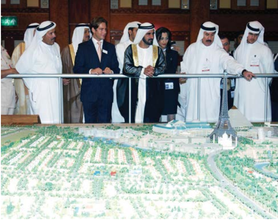
مشروع فالكون سيتي مع القطاع الخاص.