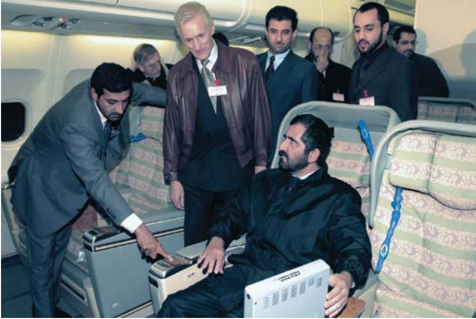
أتابع عن قرب خطط تطور طيران الإمارات: لدى تفقدي إحدى الطائرات الجديدة.