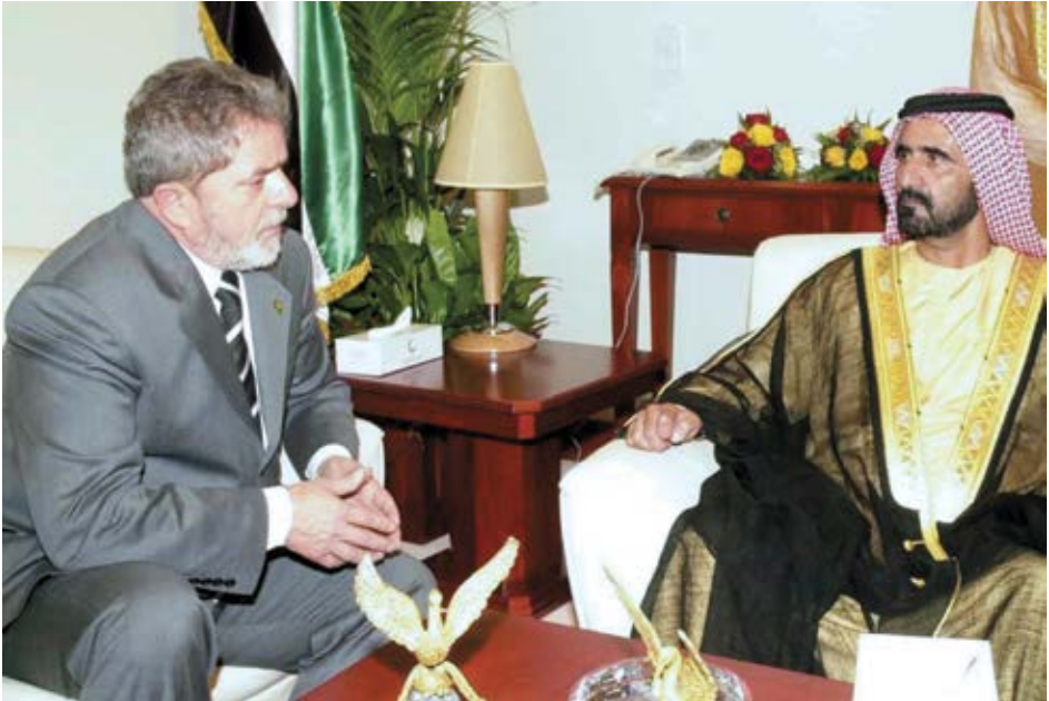
مع الرئيس البرازيلي لويس إنغناسيو لولا دا سيلفا.