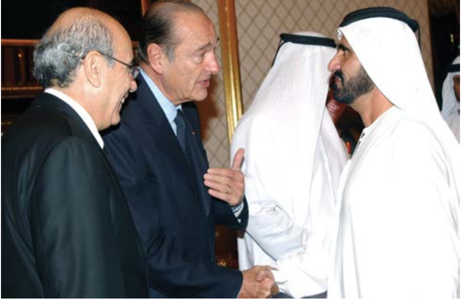
مع الرئيس الفرنسي جاك شيراك خلال زيارته إلى الإمارات.