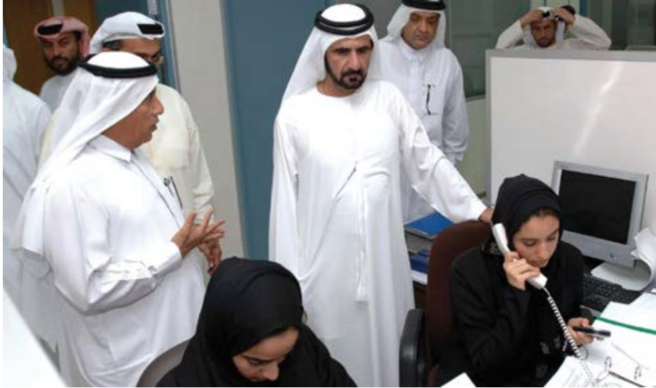
متابعتي لأداء الدوائر الحكومية تستهدف ضمان سلاسة اجراءات العمل فيها: خلال زيارة إلى إدارة الجنسية والإقامة.