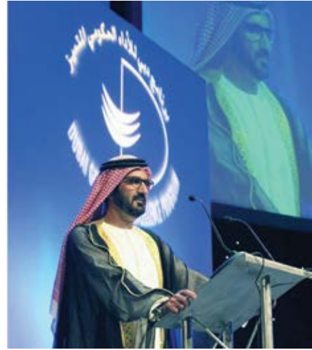
كل عام نقيم أداء مؤسساتنا الحكومية ونعلن عن نتائج التقييم في حفل برنامج دبي للأداء الحكومي التميز.