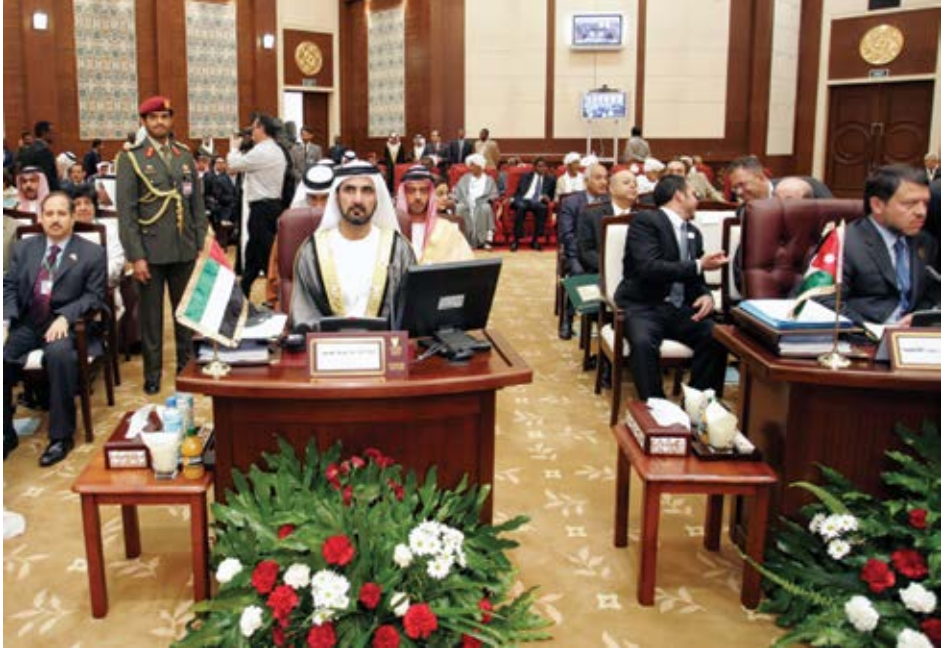
خلال حضوره القمة العربية في الخرطوم.