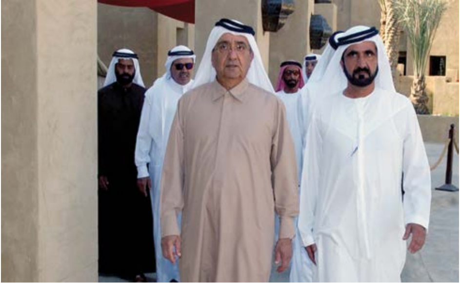
قصة نجاح دبي وانجازاتها هي قصة تعاون أخوي لتجويل الحلم إلى الحقيقة: مع شقيقي الشيخ مكتوم - طيب الله ثراه.