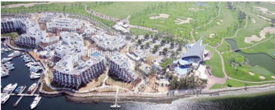
نادي خور دبي للغولف.