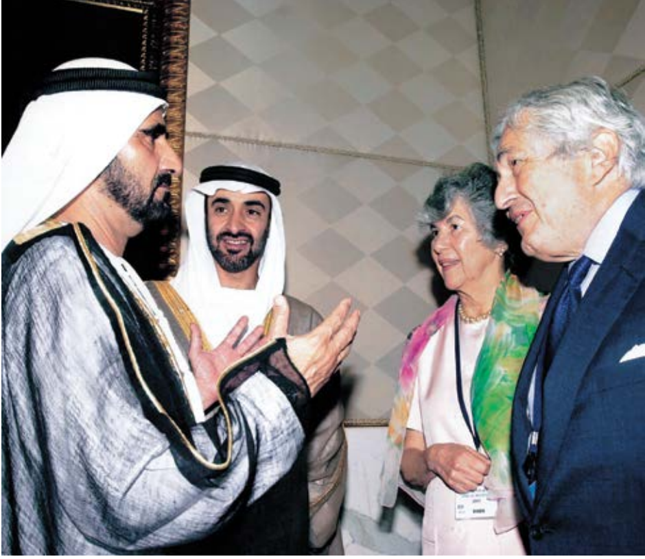
مع جيمس ويلفنسون رئيس البنك الدولي السابق وأخي الشيخ محمد بن زايد آل نهيان.