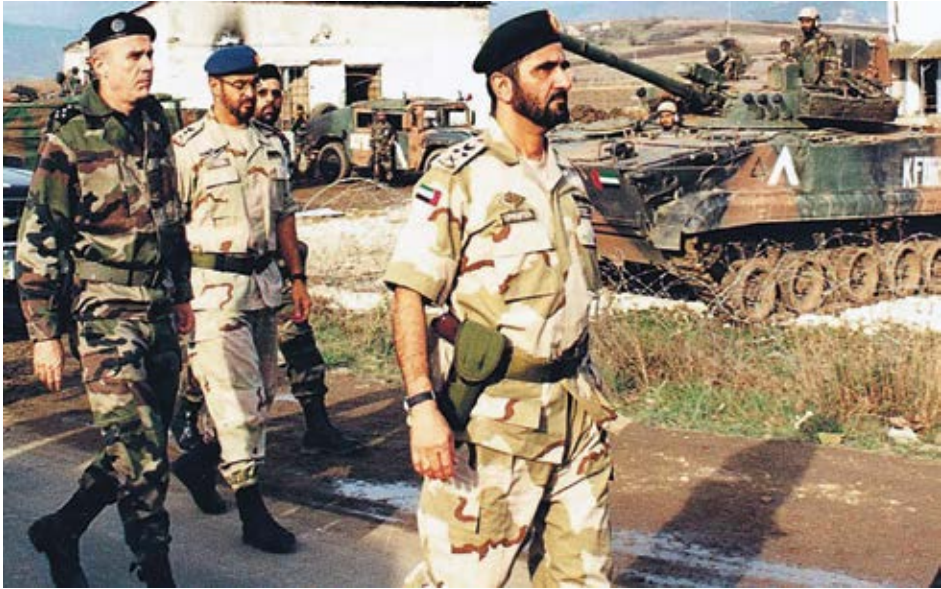
زيارة تفقدية قمت بها ل وحدات القوات المسلحة للإمارات العربية المتحدة ضمن قوات حفظ السلام في كوسوفو مع أخي سمو الشيخ محمد بن زايد .