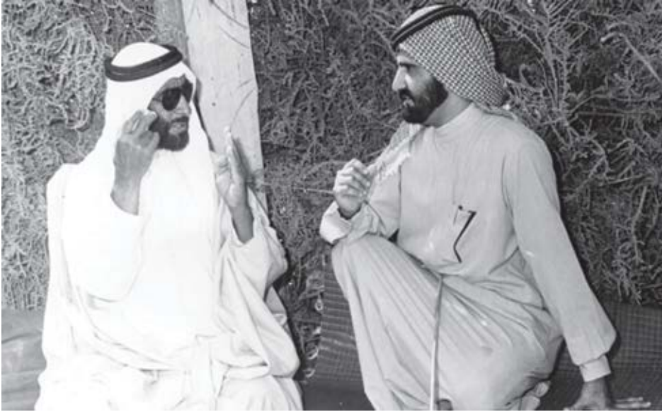
لقاء جمعني مع فقيدنا الأعز الشيخ زايد.