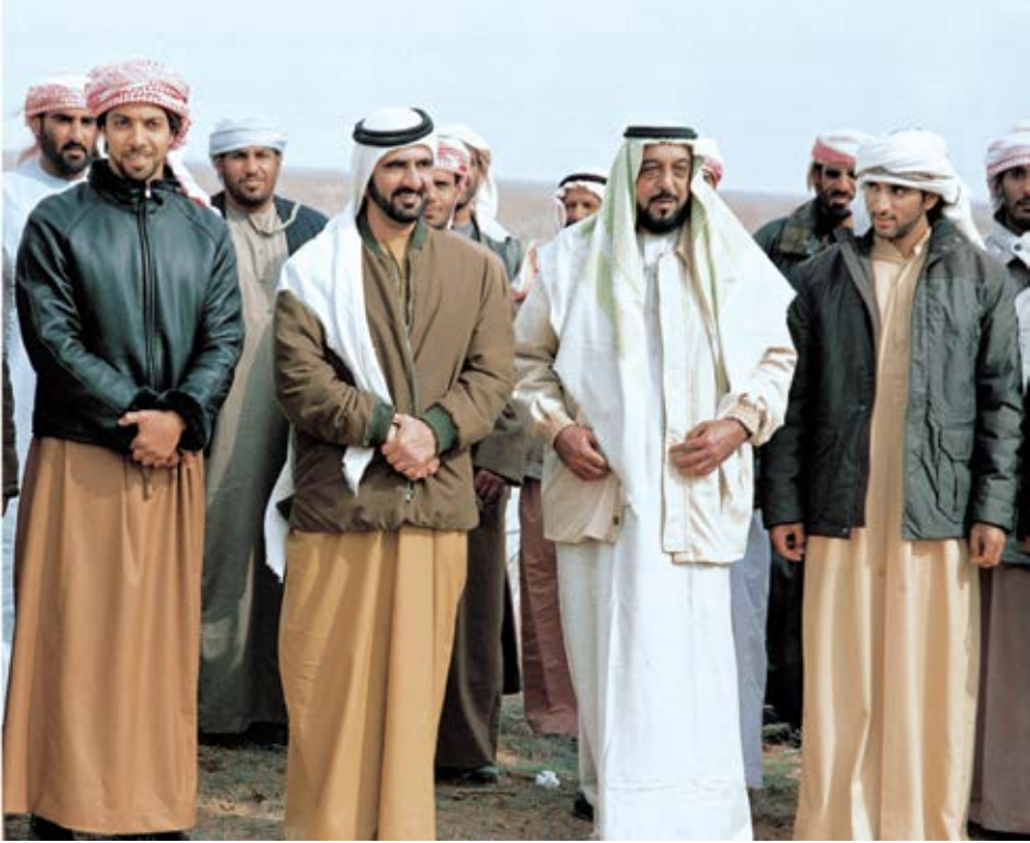
مع أخي صاحب السمو الشيخ خليفة بن زايد آل نهيان رئيس الدولة في رحلة صيد شاركنا فيها الشيخ منصور بن زايد آل نهيان وابني حمدان.