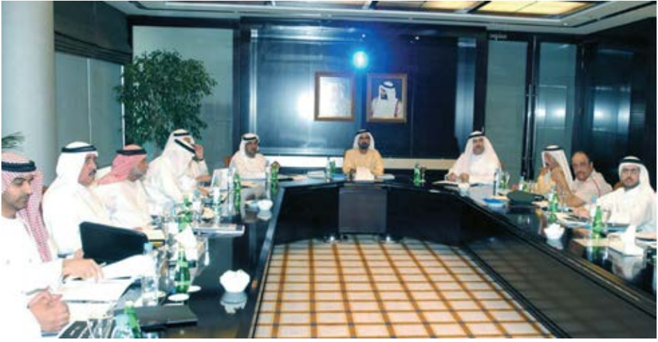
اجتماع لمجلس دبي التنفيذي الذي يتألف من قيادات إماراتية شابة وطموحة تعمل على تنفيذ رؤيتنا.