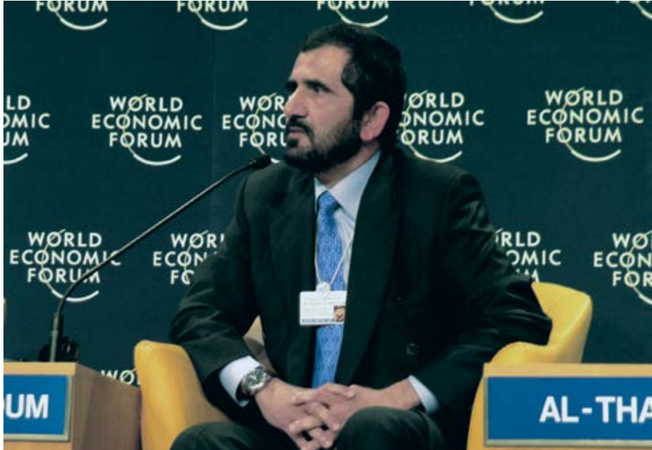
مشاركة لي في منتدى دافوس الاقتصادي العالمي في سويسرا.