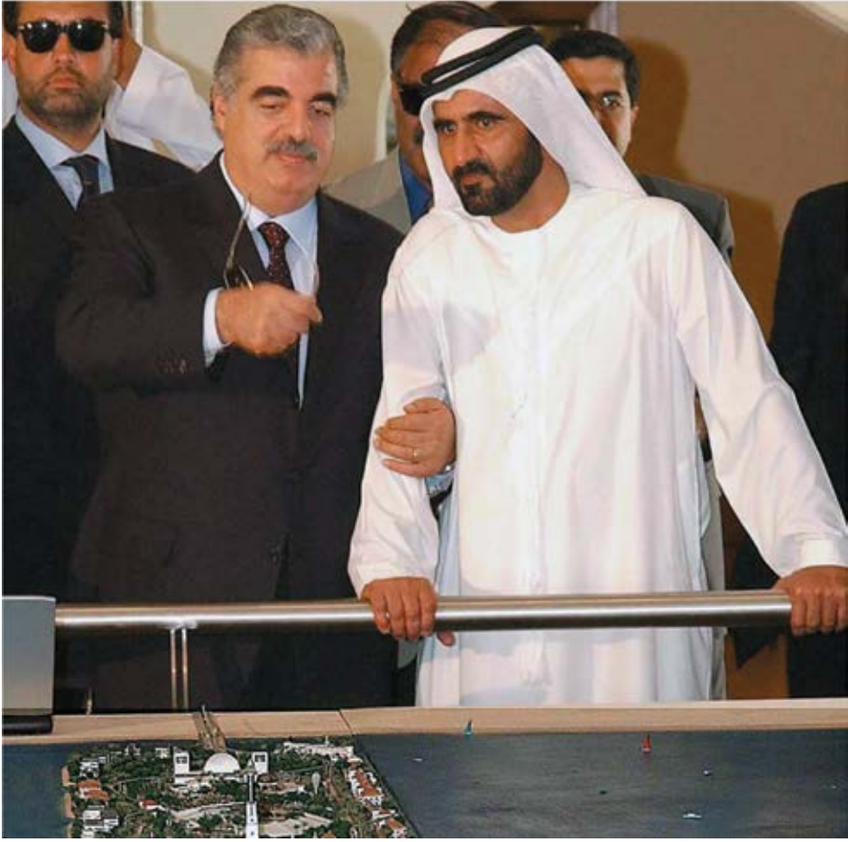
كان الشهيد رفيق الحريري - رحمه الله - حريصًا على متابعة مشاريع دبي، وقد شكل غيابَه خسارة للعرب.