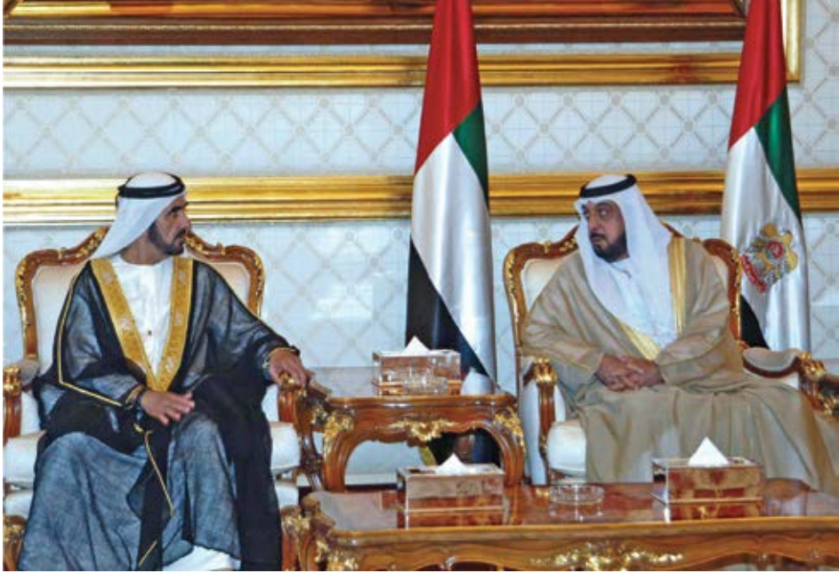
علاقتي بأخي صاحب السمو الشيخ خليفة بن زايد آل نهيان رئيس الدولة - حفظه الله - علاقة ود ومحبة واحترام.