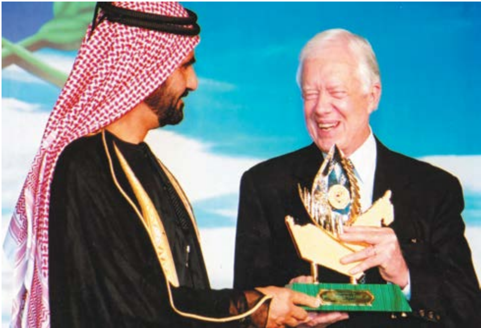
الرئيس الأميركي الأسبق جيمي كارتر يتسلم جائزة الشيخ زايد الدولية للبيئة.