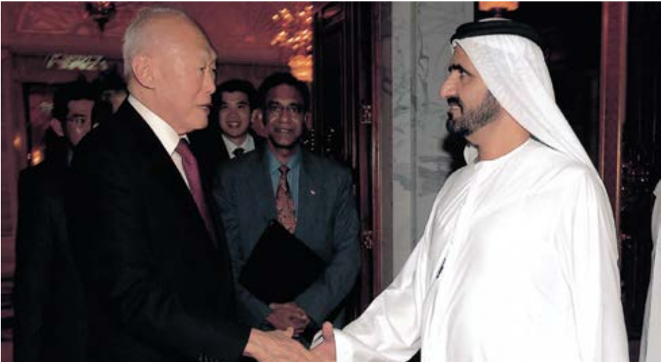
مع لي كوان يو اول رئيس وزراء لسنغافوره. dt