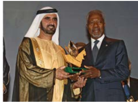
جائزة الشيخ زايد الدولية للبيئة لكوفي عنان الأمين العام للأمم المتحدة.