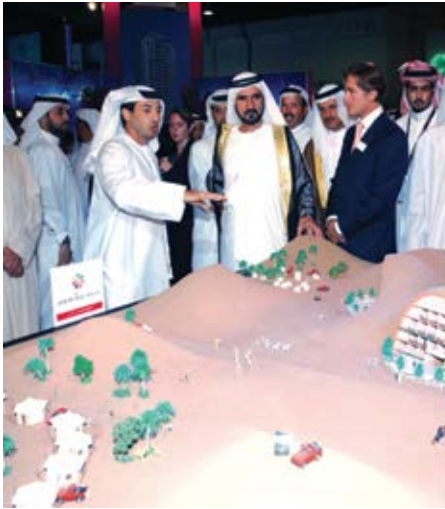
مشروع دبي لاند.