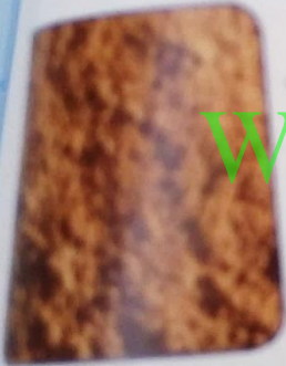
الدلك على الأرض