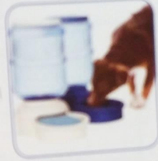
كلب يشرب الماء من الإناء