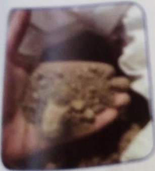
الغسل سبع مرات أولها بالتراب