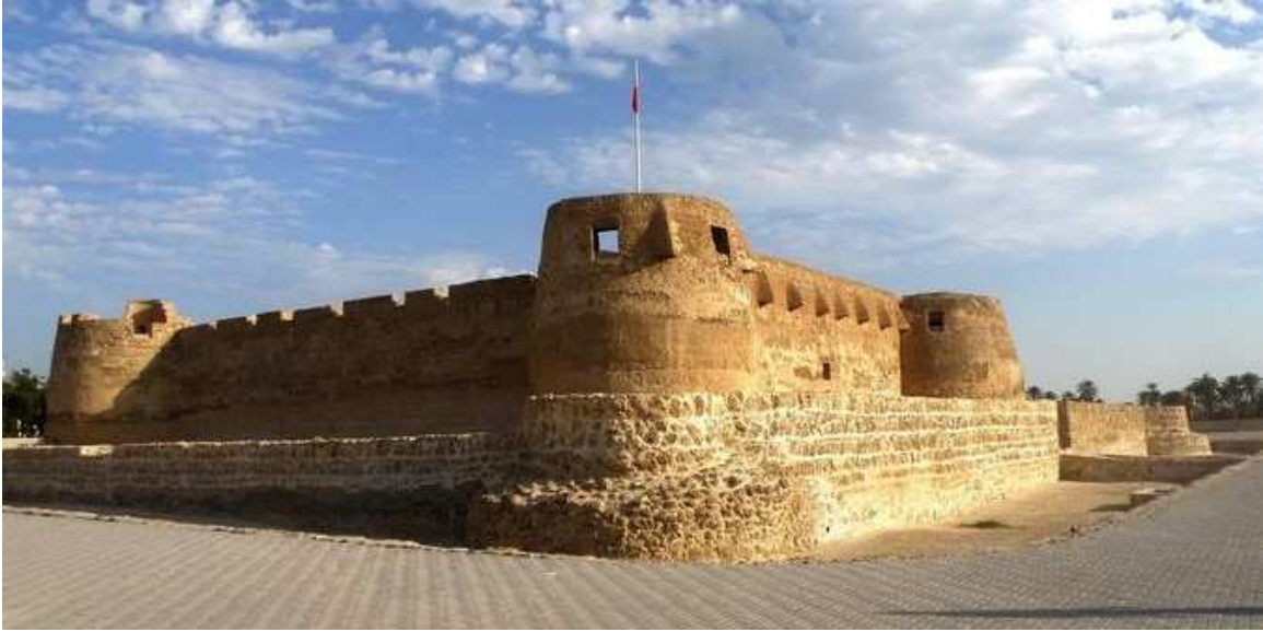
شكل ( 1 ) : يوضح حضارة دلمون القديمة في البحرين

للخليج العربي دور كبير في التاريخ القديم ، حيث سمي قديماً بالبحر الأدنى أو بحر شروق الشمس ، تعتبر حضارة دلمون من الحضارات القديمة التي تقع في الجزء الشرقي من شبه الجزيرة العربية ، وهي من أقدم الحضارات في العالم ، وقد وصفها القدماء أنها المكان الذي تشرق منه الشمس ، ووصفوها أنها أرض الأحياء ، كان أرخبيل البحرين مقر عاصمة الدلمون القديمة ، وقد سمح هذا الموقع الاستراتيجي بأن تتطور هذه الحضارة لتصبح مركزاً هاماً للتجارة في قديم الزمان ، حيث أن الخليج العربي بشكل عام كان ملتقى الحضارات الكبرى في الشرق الأوسط .